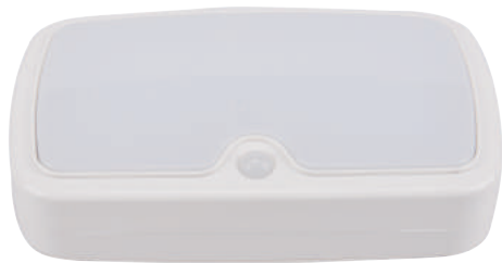
LED SENSOR CEILING FIXTURE

RS Uputstvo za montažu UA Інструкція по монтажу AR تعليمات التثبيت