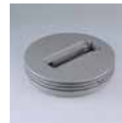
Art. MT1016 Ceiling adapter. Adaptor pentru montaj pe plafon. Adattatore montaggio a plafone.