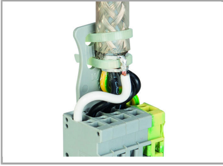
Shield termination connected to an X-COM® female plug