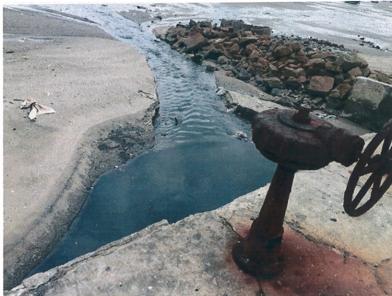
ภาพที่ 6 วันที่เก็บตัวอย่าง