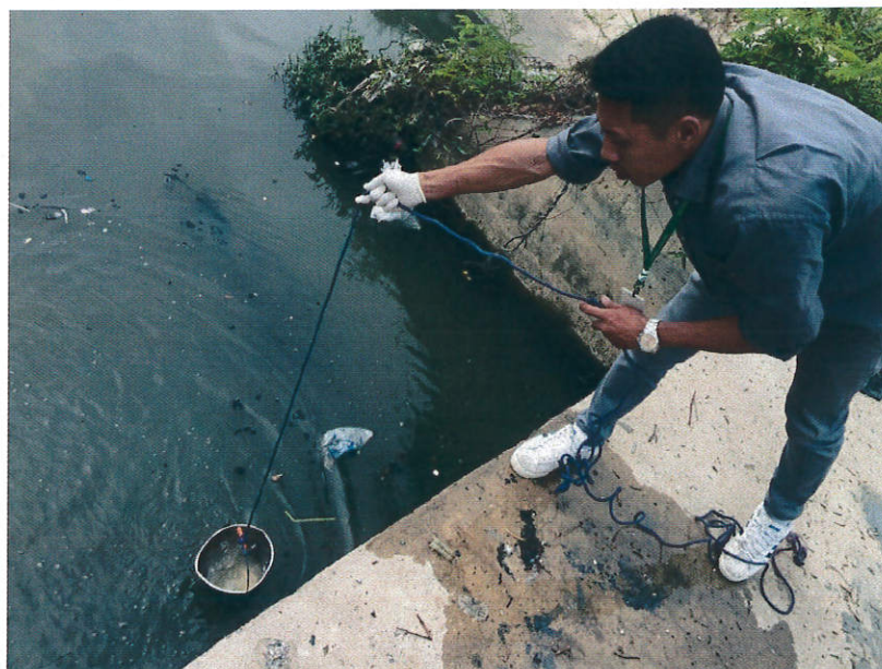
ภาพที่ 3 วันที่เก็บตัวอย่าง