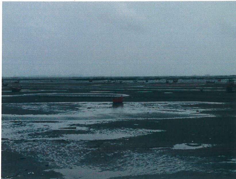
ภาพที่ 5 วันที่เก็บตัวอย่าง