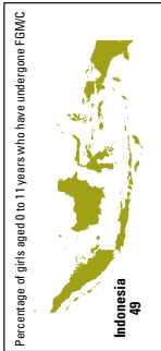
Percentage of girls aged 0 to 11 years who have undergone FGM/C