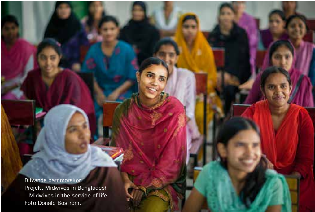
Blivande barnmorskor. Projekt Midwives in Bangladesh – Midwives in the service of life.

” I Bangladesh har vi arbetat med ett projekt som syftade till att lyfta barnmorskans viktiga roll i arbetet mot mödra- och barnadödlighet, och har på nära håll kunnat följa starten av en ny treårig barnmorskeutbildning.