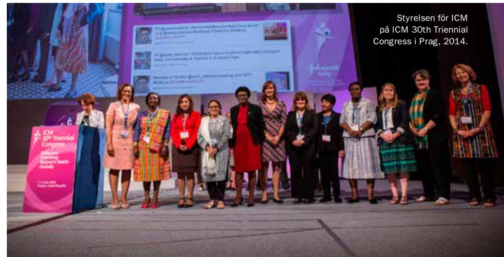
Styrelsen för ICM på ICM 30th Triennial Congress i Prag, 2014.

Via mitt styrelseuppdrag i International Confederation of Midwives (ICM) har jag lärt känna många kollegor från Afrika, Asien, Europa, Nord- och Sydamerika, Australien och Nya Zeeland. Jag är otroligt imponerad över den kompetens och det engagemang som finns i kåren globalt. Via ICM har jag också vid ett par tillfällen deltagit i arbete med att ta fram globala kvalitetsindikatorer och riktlinjer på uppdrag av WHO. Ibland har det känts befriande med detta arbete därför att alla har ett gemensamt mål, nämligen