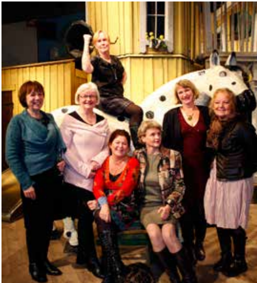
Förbundsstyrelsen på Junibacken, Reproaktiv Hälsa 2009.

Den andra stora händelsen är att samkönade par i dag öppet kan bli föräldrar. Att en familj inte måste vara en kvinna plus en man utan kan se ut hur som helst, det är fantastiskt. Jag tror att vi alla kämpar med outtalande fördomar mot allt som är främmande. Först när vi är medvetna om denna sida hos oss själva, kan vi på allvar förändra ett invariant mönster och inkludera dem som lever på ett annat sätt. Under år 2014 träffade jag för första gången en man som födde barn. Debatten om alternativa vägar till föräldraskap och surrogatmödraskap (värdmödraskap) är för många en svår fråga ur ett etiskt, ekonomiskt och juridiskt perspektiv. Min filosofi som barnmorska är att ge alla som kommer i min väg, den bästa vård de kan få oavsett hur de löst sin barnlängtan. Mitt uppdrag är alltid att stötta och vårda den gravida kvinnan/mannen under graviditet och barnafödande.