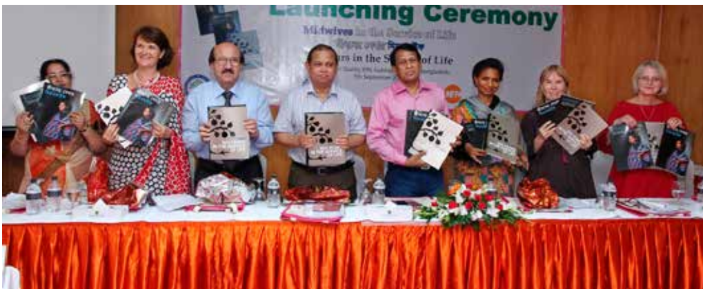
Projekt Midwives in Bangladesh – Midwives in the service of life, boksläppet i Bangladesh, 2013.