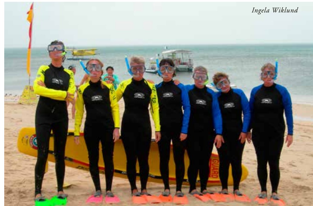
Snorklande barnmorskor i Australien, ICM Congress 2005.

Vårt yrke innebär potentiellt en hälsorisk, att bli utsatt för blodsmitta, infektioner och stressrelaterade åkommor. I vissa länder är barnmorskor dessutom en måltavla i krig.