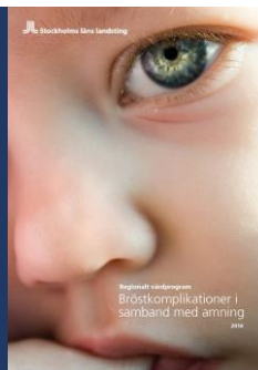
Regionalt vårdprogram Bröstkomplikationer i samband med amning AM