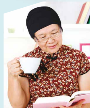
Topi Beanie untuk Warga Emas