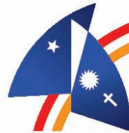
Sociedade Pernambucana de Pneumologia e Tisiologia