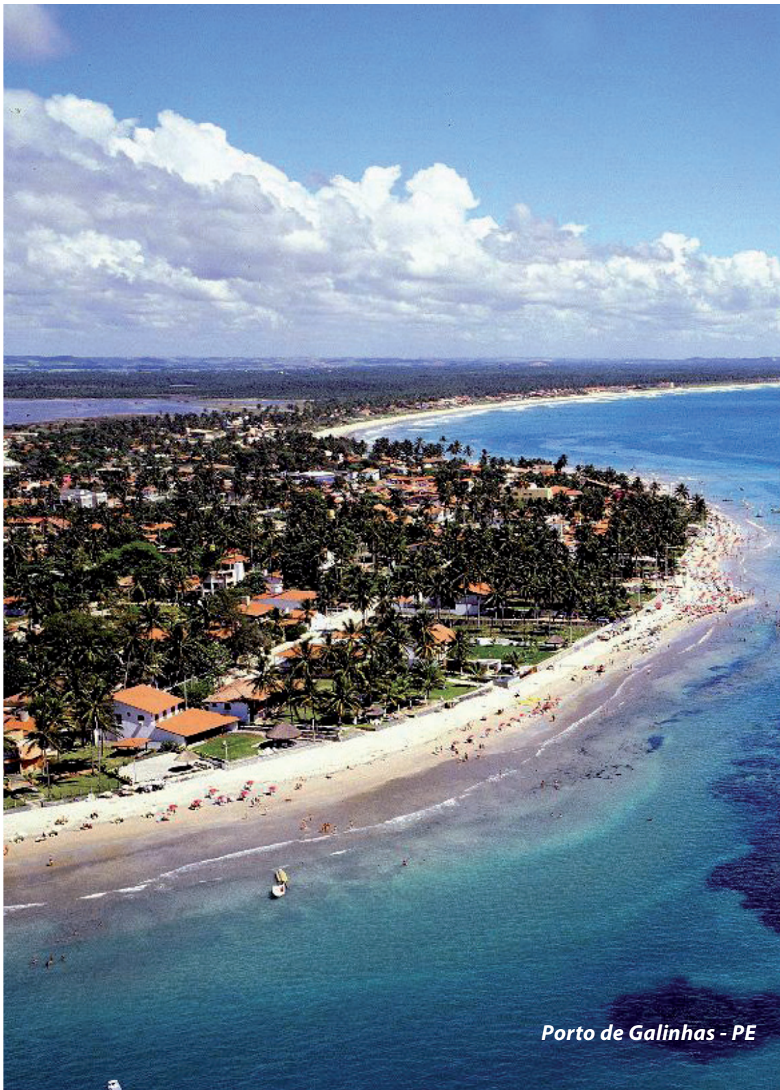
Porto de Galinhas - PE