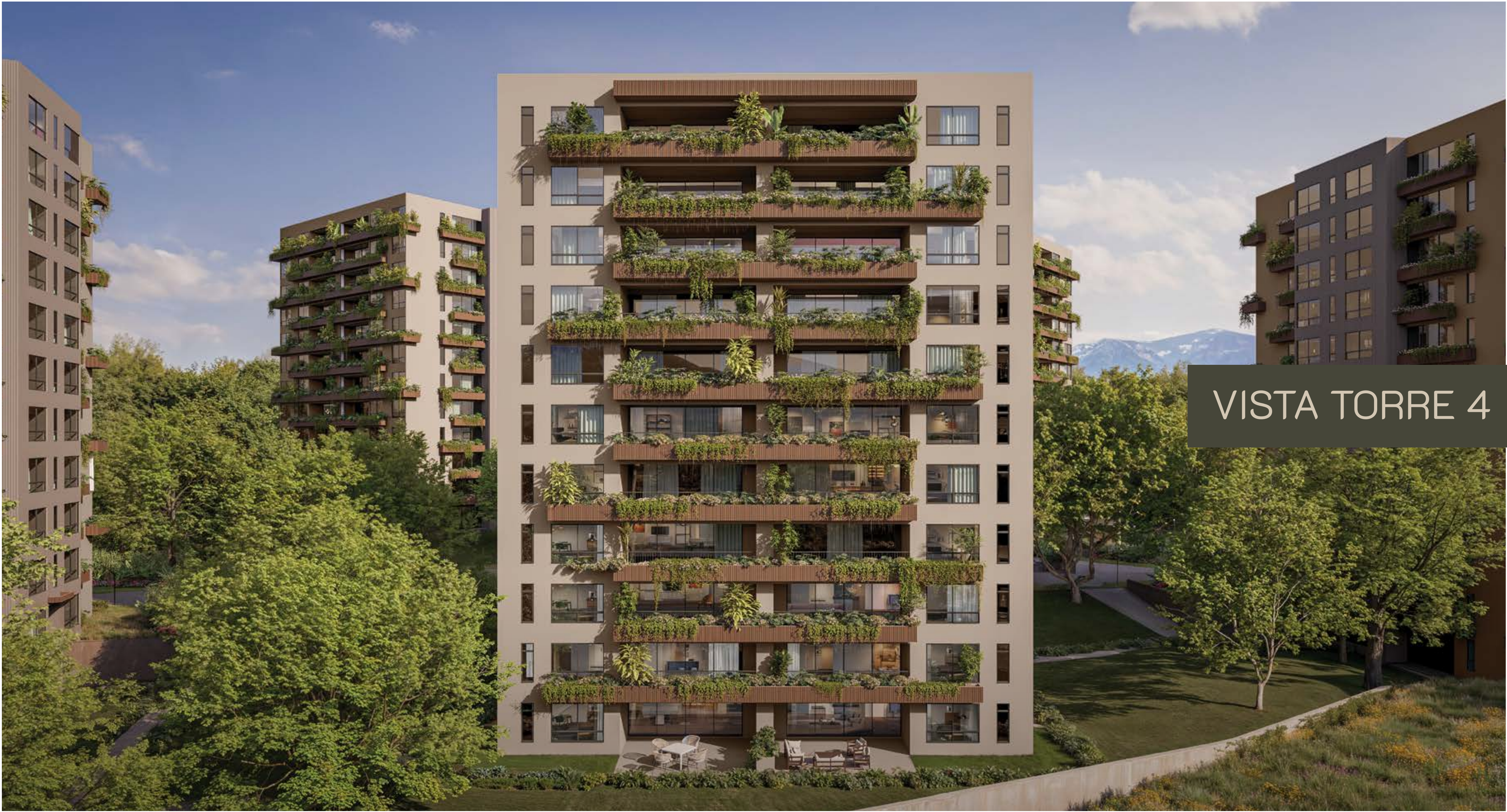
VISTA TORRE 4