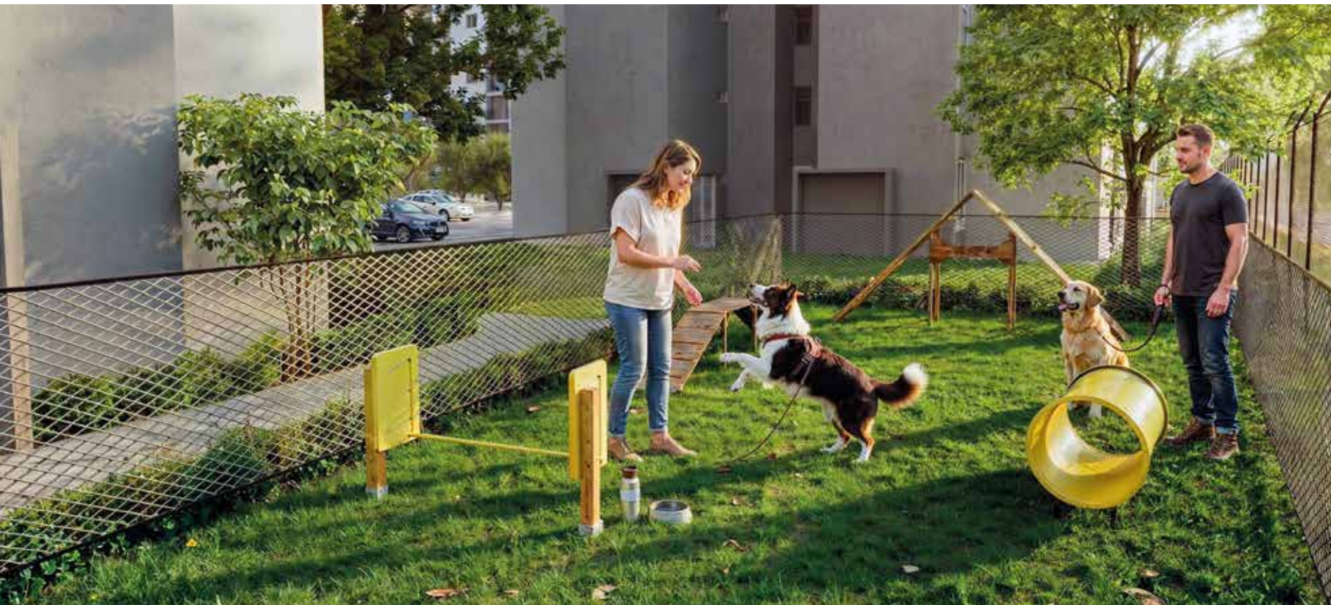
ZONA PARA MASCOTAS