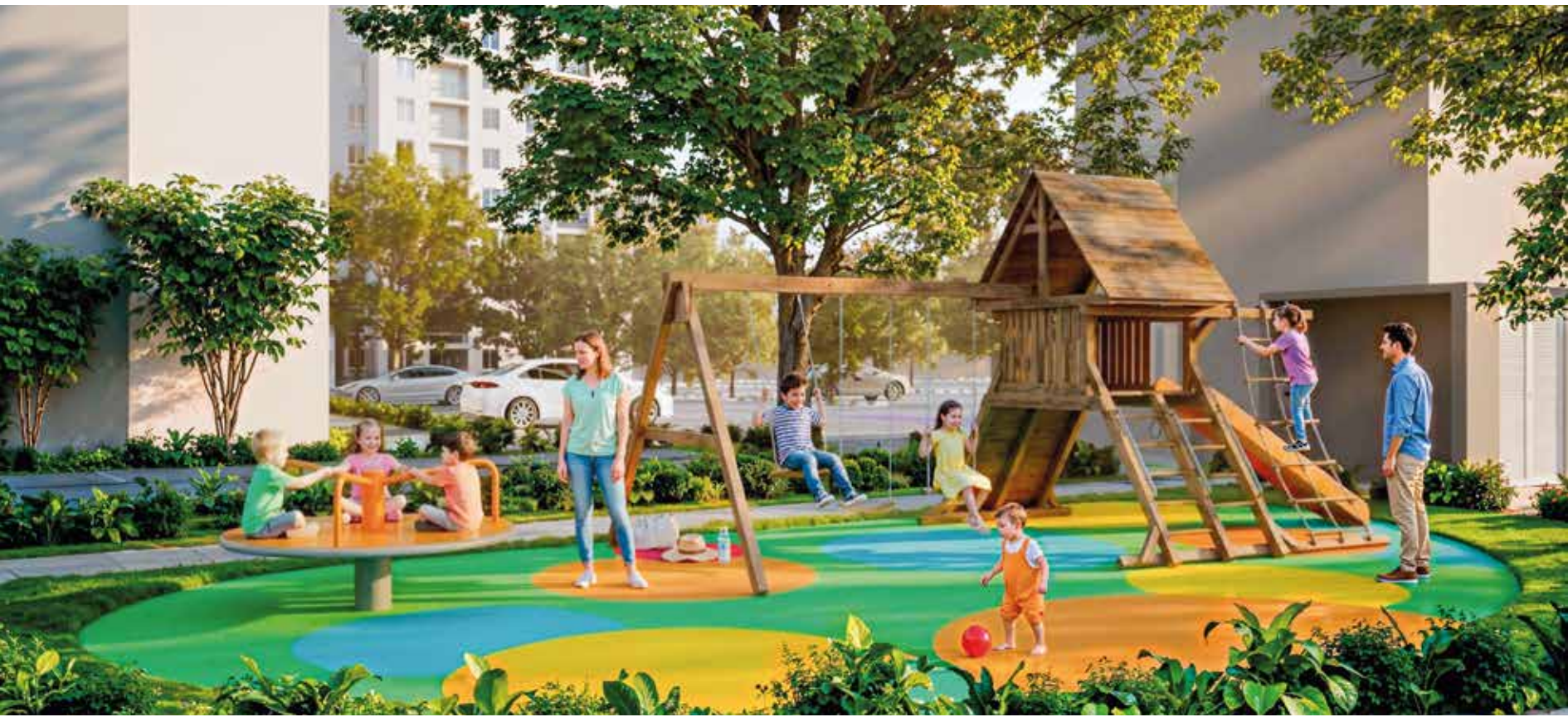
ZONA DE JUEGOS INFANTILES