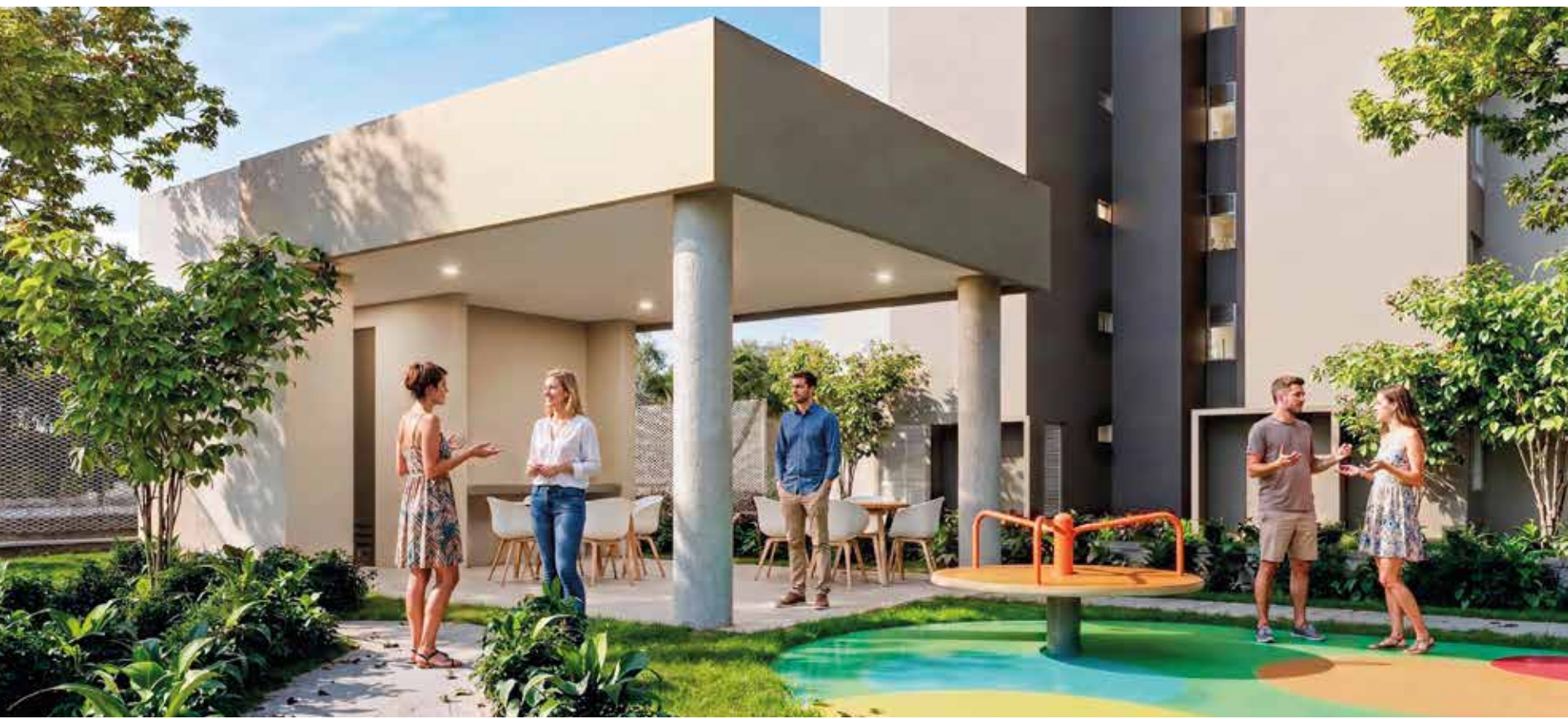
SALÓN SOCIAL AUXILIAR