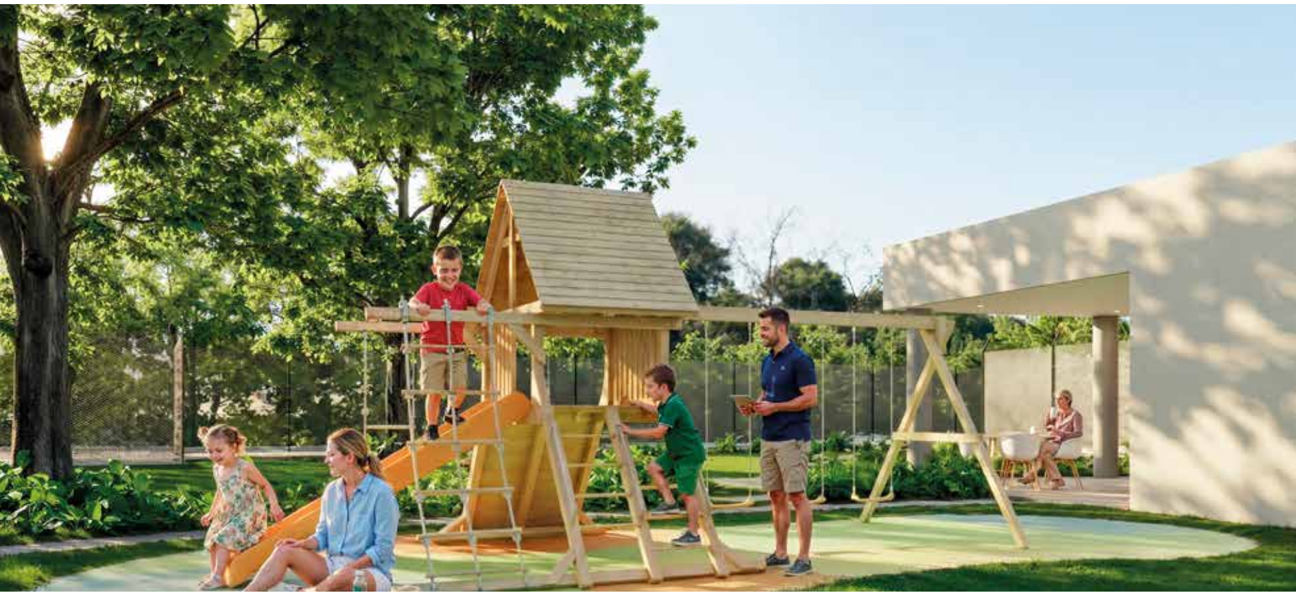
ZONA DE JUEGOS INFANTILES