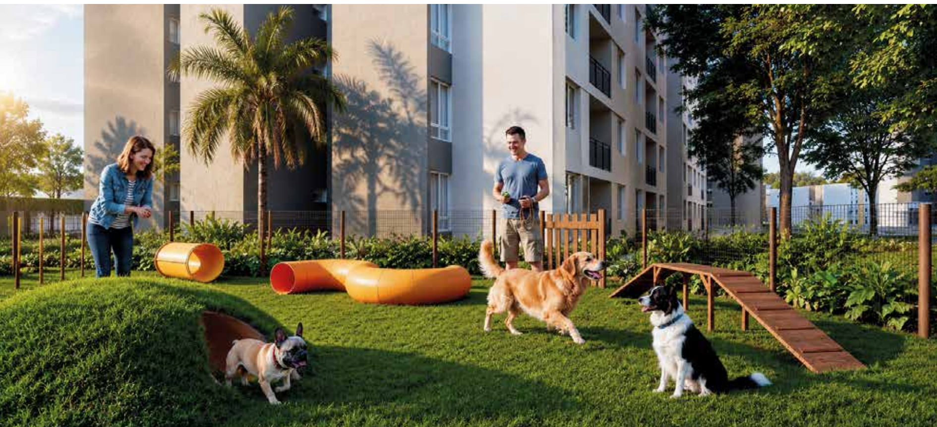
ZONA PARA MASCOTAS