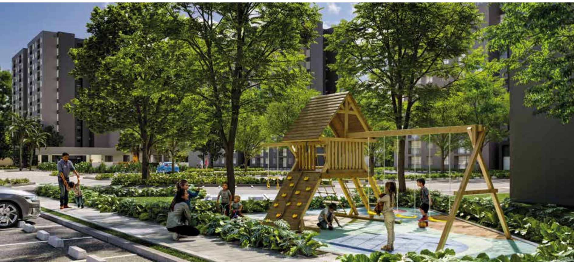
ZONA DE JUEGOS INFANTILES