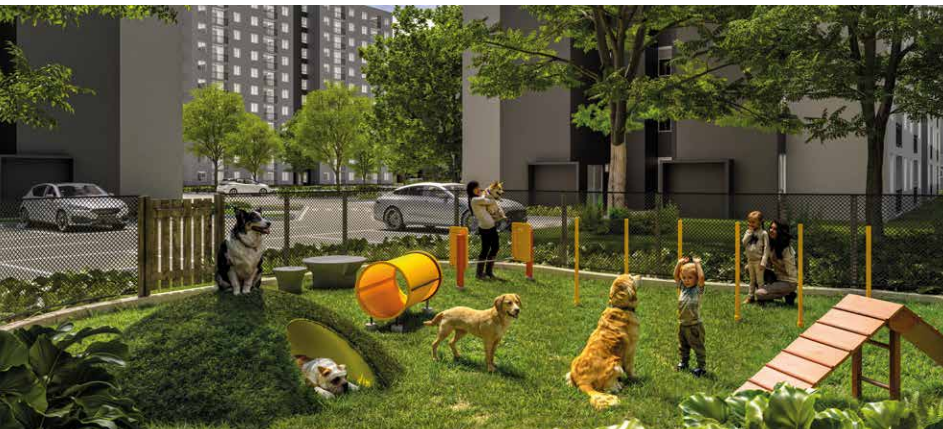
ZONA PARA MASCOTAS