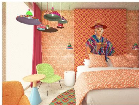
Renderings Room Designs Noordwest en Zuidwest