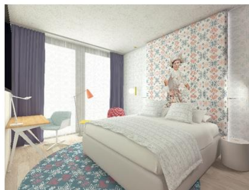
Renderings Room Designs Oost en Noord