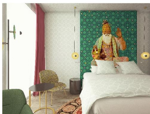
Renderings Room Designs Zuid en Zuidoost