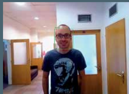
Termokamera spolupracuje s docházkovým systémem a může nemocnému rovnou zamezit ve vstupu do podniku.

kterým procházejí osoby postupně, nikoli ve skupině. „Naše termokamery jsou nyní ve fázi komplexně funkčního prototypu, výroba prvních kusů je již v přípravě,“ říká Radek Bábíček, jednatel společnosti Satomar. „Jsou dostupným řešením pro malé provozny i velké společnosti, kde mohou třeba i na několika místech současně monitorovat zdravotní stav zaměstnanců. Ke zprovoznění je zapotřebí mít v dosahu kamery pouze wi-fi nebo ethernetové připojení a elektrickou zásuvku,“ dodává. U vyšších modelů se cena pohybuje do 15 tisíc korun, vedle toho bude s provozem cloudového systému spojen měsíční poplatek v řádu stokorun. x (red)