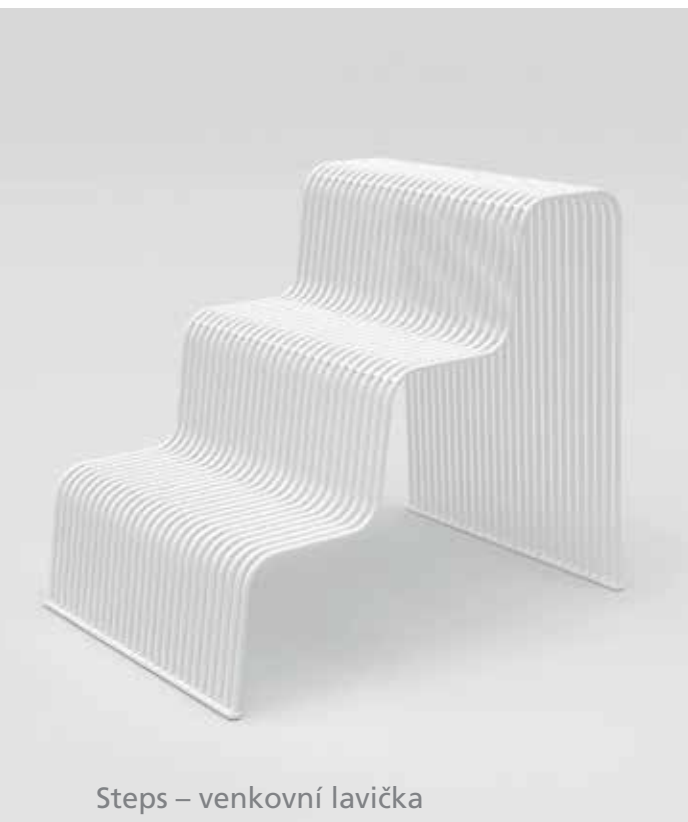
Steps – venkovní lavička