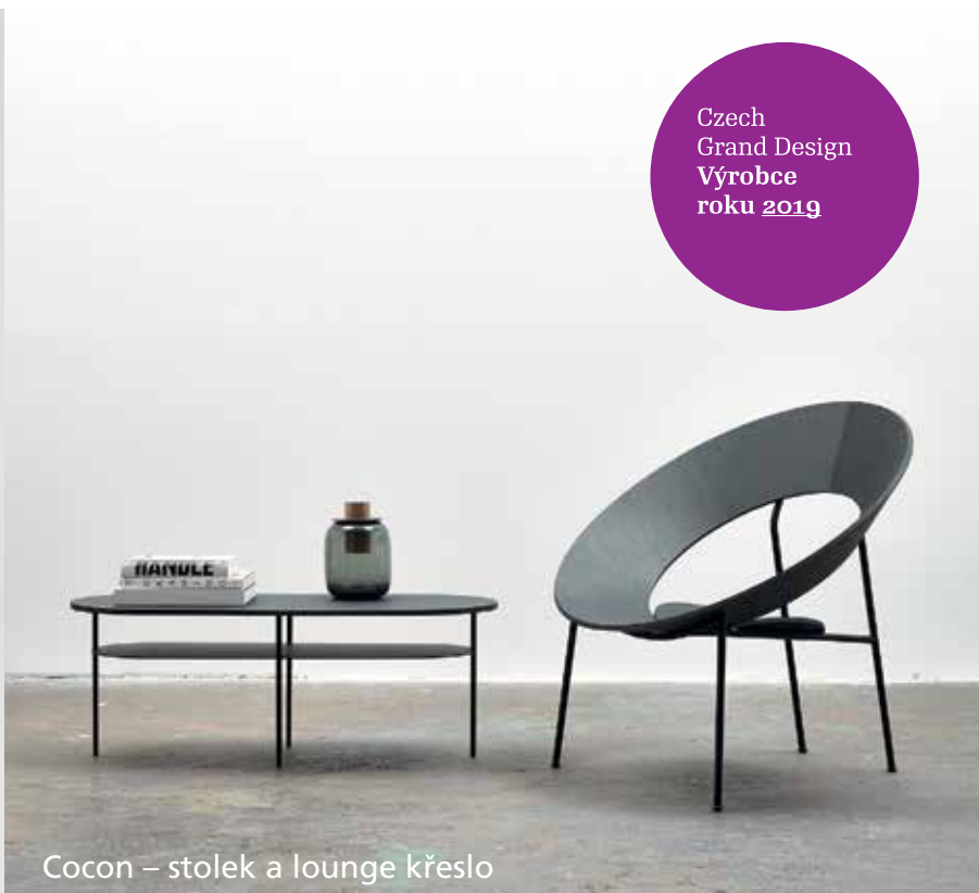
Cocon – stolek a lounge křeslo