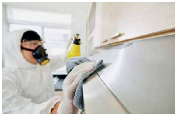
Exportéři chtějí vzhledem k postupnému uspokojení poptávky v České republice začít vyvážet dezinfekci či hygienické ochranné pomůcky do zahraničí.

Společný projekt agentury CzechTrade a ministerstev průmyslu a obchodu a zahraničních věcí, který poskytuje českým firmám informace, poradenské a asistenční služby při exportních aktivitách, přizpůsobil svoji činnosti požadavkům firem v době krizových opatření. Počet podniků, které se kvůli omezení činnosti v krizovém stavu ocitly ve složité situaci, se zvýšil. Souvisí to zejména s útlumem či změnou výrobní činnosti některých