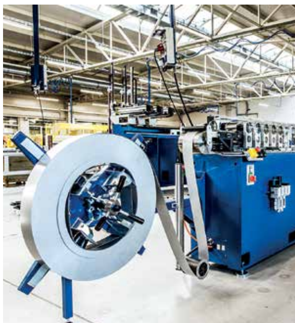
Jihomoravská firma zatím vyvezla do Latinské Ameriky čtyři stroje na výrobu žaluzií.

ZEBR chce vstoupit i na další trhy latinskoamerického regionu.