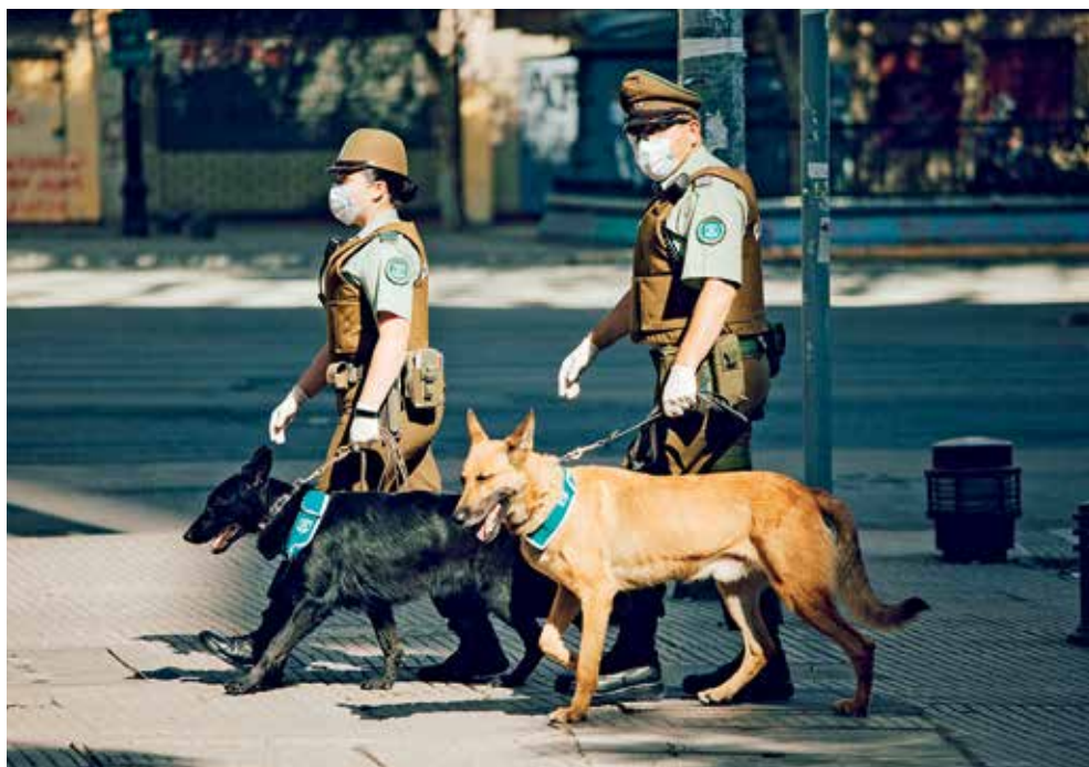
V Chile dohlíží na dodržování ochranných opatření policie nekompromisně.

Tyto okolnosti měly vliv na latinsko-americký styl obchodního vyjednávání i na tamější firemní kulturu. Mluví se o probuzení a aktivizaci soukromého sektoru, který v mnoha latinskoamerických zemích neváhal vyčlenit prostředky na potřebné a smysluplné projekty. Například několik nejlivnějších chilských podnikatelů iniciovalo fond s cílem přispět 50 miliard dolarů k řešení těch nejakutnějších potřeb ve