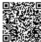
Více o vzestupu digitalizace v Chile

Aby andský region zvládl dostat se z postpandemické krize úspěšně, je zapotřebí postupovat podle správného receptu. Podle Meziamerické rozvojové banky (IDB) by nyní lokální administrativy měly soustředit veškerou svou energii na princip „build back better“, tedy budovat, respektive obnovovat lépe, kvalitněji, efektivněji. IDB například uvádí, že v regionu Latinské Ameriky a Ka-