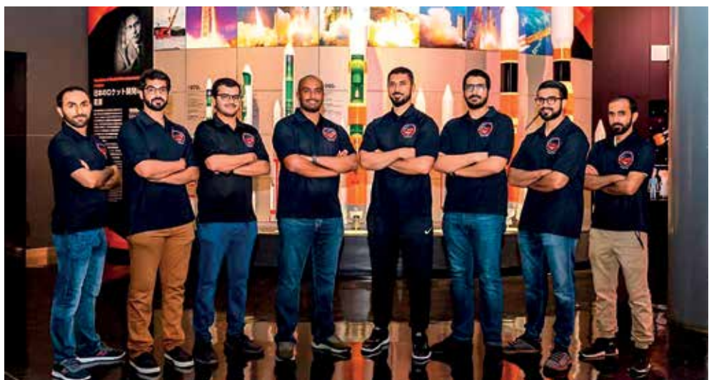
Sonda, kterou do vesmíru vynesla raketa z kosmodromu v Japonsku, váží 1350 kilogramů a na jejím sestavení spolupracovali Emirátané s americkými vědci.