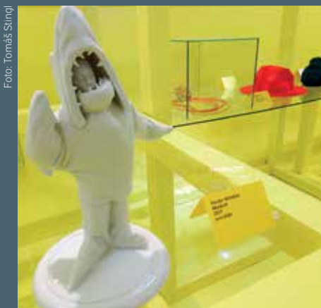
Zvláštní cenu získala Moravská galerie za nákup nových exponátů.