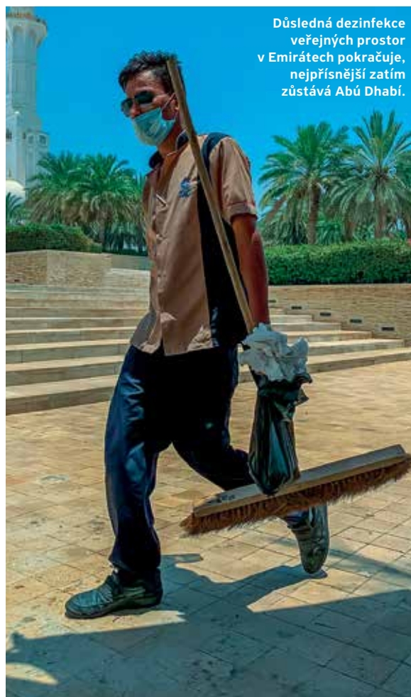
Důsledná dezinfekce veřejných prostor v Emirátech pokračuje, nejpřísnější zatím zůstává Abú Dhabí.

Velmi postižen je hotelový sektor a turismus obecně. Jen v emirátu