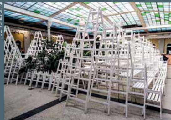
Instalace postavená z 222 štaflí byla centrem celé výstavy.