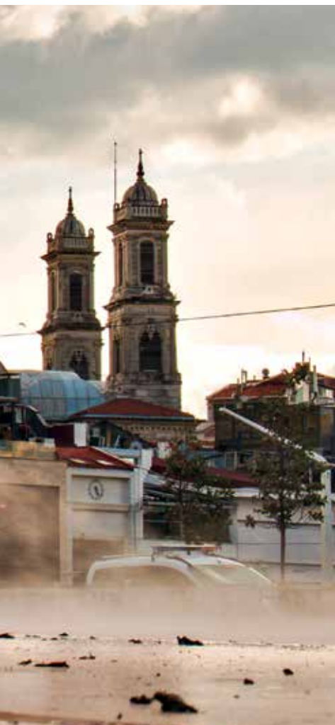
Ulice Istanbulu zely v době vrcholu pandemie prázdnotou.

pozitivního salda, jež za prvních šest měsíců přesáhlo hodnotu 5,8 miliard korun. Ve stejném období loňského roku představovalo saldo jednu miliardu korun.