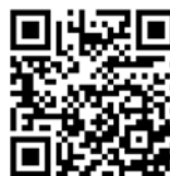
▲ Přihláška do soutěže a podrobné zadání

► Jaké je zadání a co se bude hodnotit? Pro všechny účastníky soutěže je připraven jednoduchý úkol – prostřednictvím svého řešení odprezentovat konkrétní produkt, inkubátor od firmy TSE, a tuto propagaci zahrnout jako součást digitálního rozhraní, do kterého bude možné doplnit další formy prezentace nejrůznějších produktů tuzemských firem jako například videoprezentaci, diskusní prostor či možnost přidání klientského a distribučního rozhraní.