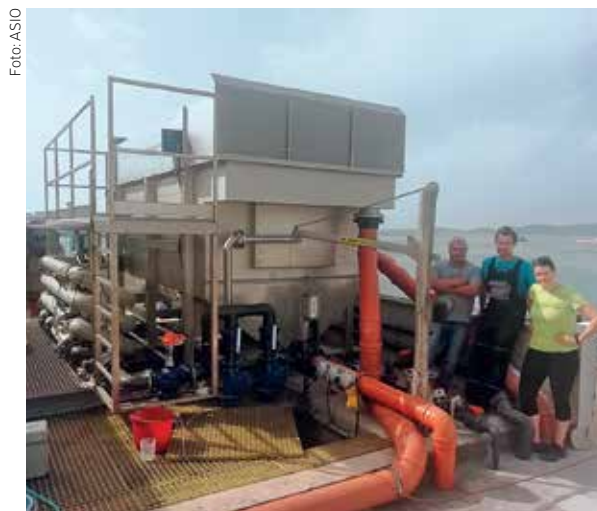
Zatím neúspěšnější byl pro ASIO v Chorvatsku loňský rok, kdy tam finanční objem zakázek dosáhl 25 milionů korun.

Co se týče mentality Chorvatů a jejich obchodního stylu, neexistuje podle