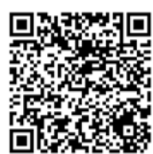
▲ Více o programu Česká kvalita

Řada firem a výrobků již tuto značku získala, ale existuje mnohem více dalších, které ji rovněž mohou získat. Když se budou výrobci do programu Ministerstva průmyslu a obchodu hlásit se svými produkty a spotřebitelé je budou kupovat, pomůže to zvyšování podílu kvalitnějšího zboží na trhu a růstu spotřeby zboží vyrobeného v ČR. Výrobci by se neměli bát do programu Česká kvalita přihlásit a získat tak možnost označovat své výrobky a služby. Týká se to i výrobků a služeb proexportního charakteru, a to zejména výrobků inovativních, s originálním řešením, jež stojí v mezinárodní konkurenci a na světových trzích. Aktivita Ministerstva průmyslu a obchodu a proexportní agentury CzechTrade v oblasti podpory vývozu napomáhají