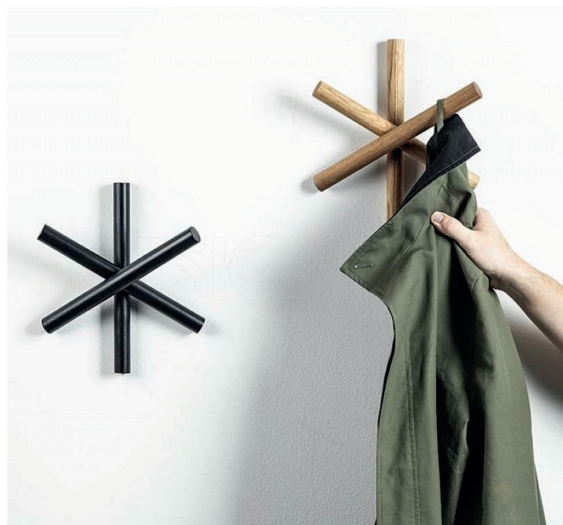
TON - Logs - Věšák z odřezků