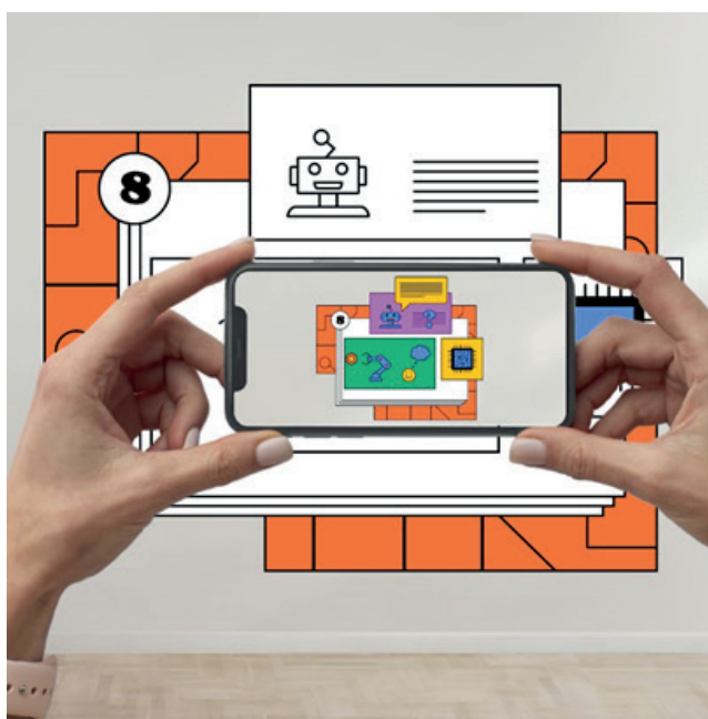
Vizualizace výstavy Innovations for Sustainable Future

Výstavu doplňuje programová linie živých akcí postavených na úspěšném formátu Science Café . Jde o přednášky a diskuse s osobnostmi české a evropské vědy inspirované formáty jako TED Talks. Science Café se v řadě Českých center již etablovala, a to i na úrovni spolupráce v rámci sítě EUNIC. Lze uvažovat také o dalších doplňkových formátech, jako jsou prezentace uměleckých děl vzniklých za přispění či zcela v režii algoritmů a umělé inteligence (hudební skladby, umělecké vizualizace) a podobně. Výstavu lze zároveň využít jako pozadí pro pořádání dalších různorodých jednorázových akcí v oblasti vědy a inovací.