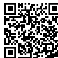
Podrobné informace k sektoru

Sektor rostl v posledních 5 letech s průměrným ročním tempem 17 % a v posledních třech letech se pohybuje okolo 30 mld. USD. Pomohlo tomu i přibližně 70 tisíc zaměstnanců pracujících ve vládou štědře podporovaných R&D centrech a technoparcích. Potřeba digitalizace je zmíněna ve všech základních vládních strategiích. Prioritami zůstává digitalizace malých a středních společností, rozvoj AI i podpora herního průmyslu.