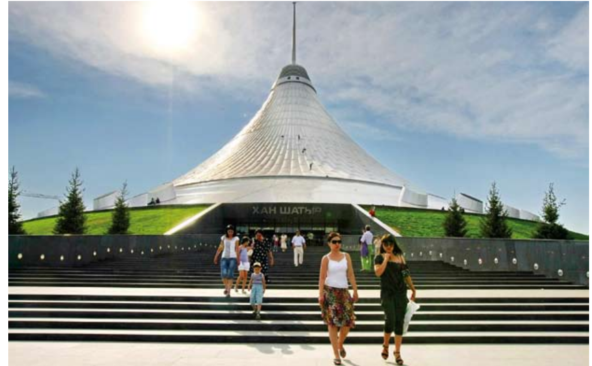
Luxusní obchodní dům Chan Šatyr má připomínat stan.

Pozoruhodnou stavbou je skleněný Palác míru a souladu. Skleněná pyramida s poněkud patetickým názvem má být místem, které ztělesňuje náboženskou a národnostní toleranci, na niž je Kazachstán velmi hrdý. V zemi se setkává mnoho náboženství