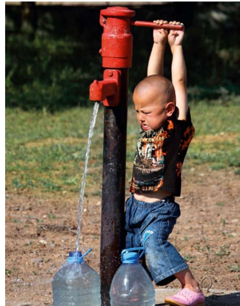
Pro mnoho Kazachů je zatím přístup k pitné vodě problémem.

Druhé bolavé místo jsou státní svátky. „Snad nikde jinde jich není tolik a Kazachové využijí každý svátek, aby jej patřičně oslavili. Třetí překážkou, s níž se budete každodenně potýkat, jsou návštěvy. Pravidelně uslyšíte, že ‚prijéchalí gósti‘, a tím