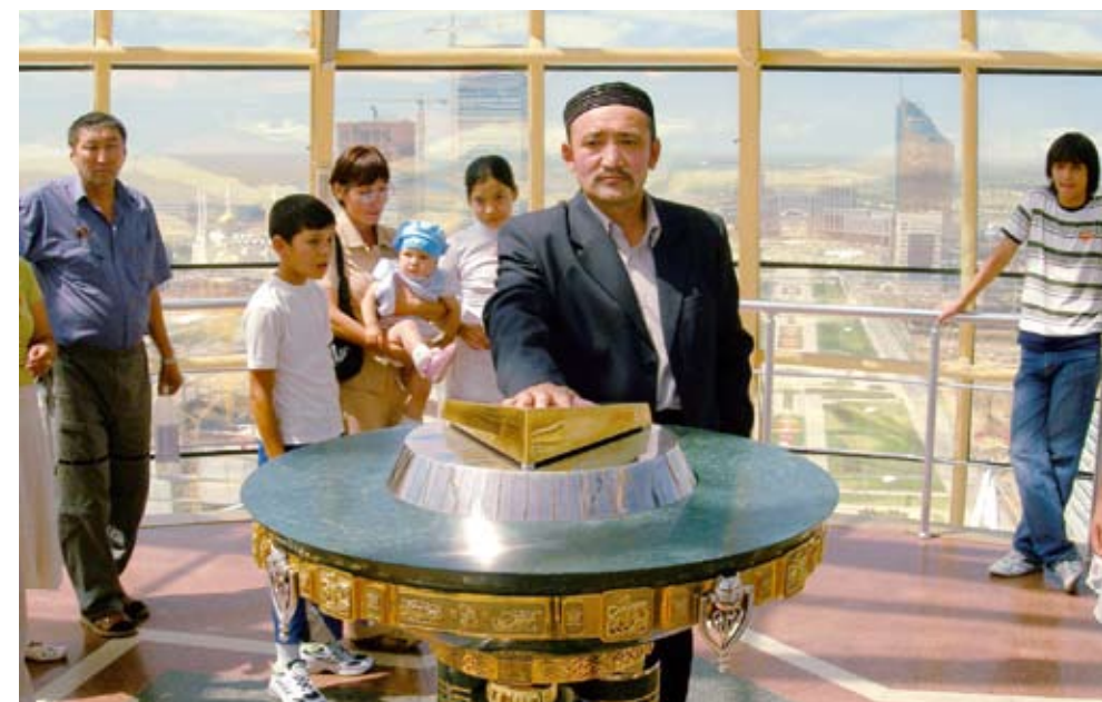
Kazaši se rádi fotí s rukou přiloženou na zlatý podstavec ve vyhlídkové věži Bajterek, do něž je vyřezán obrys ruky prezidenta Nursultana Nazarbajeva.

Oč opatrněji tedy musí prezident našlapovat na domácí půdě, o to aktivnější může být v zahraničí. A také tak činí. V průběhu loňského roku poklesl objem vzájemného obchodu s Ruskem o hrozivých 20 procent (většinu z toho má na svědomí pokles rublu), obchod s Čínou naopak o 20 procent narostl. A tím to nekončí – v prosinci oznámili kazašský a čínský premiér na třicet nových obchodních dohod v hodnotě 14 miliard dolarů. Téměř čtyři miliardy čínských dolarů půjdou do továren na výrobu drasla na západě Kazachstánu; Číňané budou do Kazachstánu dodávat elektrárny na klíč, zatímco obráceným směrem bude putovat mnoho uranu, jehož největším světovým producentem Kazachstán je.