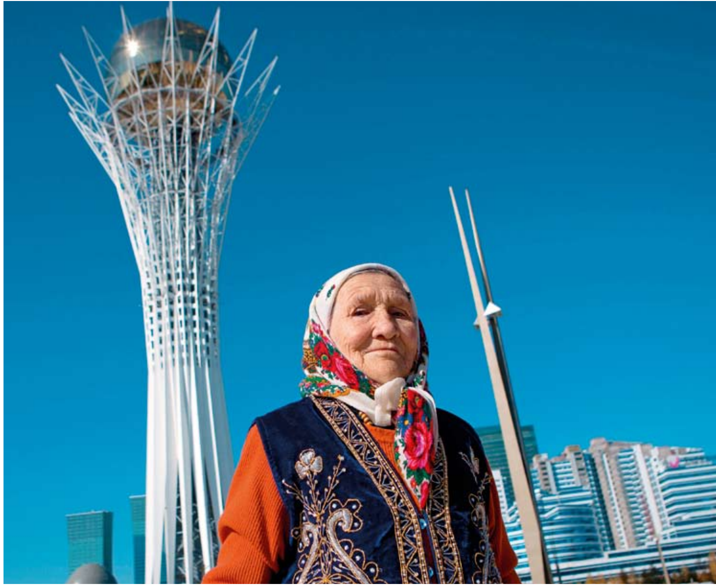
Moderní vyhlídková věž Bajterek udivuje výletníky z kazašského venkova.