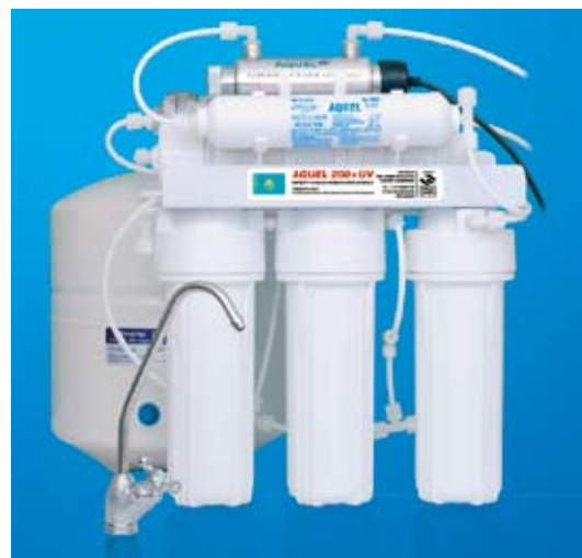
Vodní filtr Aquel 200 se stal nejúspěšnějším výrobkem firmy prodávaným v Kazachstánu.

V Kazachstánu stojí česká společnost hlavně proti čínské a ruské konkurenci. Ta prodává především jednoduché uhlíkové filtry za nízkou cenu. Aquel proti tomu nastoupil s technicky daleko vyspělejšími filtry, a navíc nabídl Kazachům i plnohodnotný servis. „Získáváme velmi dobré reference, protože jako jediní máme přesně daný systém prodeje a násled-