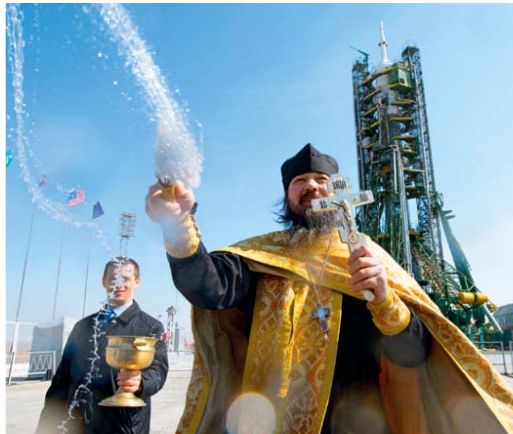
Startu rakety Sojuz loni v listopadu pro jistotu žehnal i pravoslavný kněz.

Další spor se týká vedení přílehlého města Bajkonur. To bylo v rámci nájemní smlouvy převedeno dočasně pod správu Ruska, víc než třetinu obyvatel navíc tvoří Rusové. Nyní ale Kazachstán usiluje o to, aby město ležící na jeho území bylo vráceno pod plnou kazašskou jurisdikci.