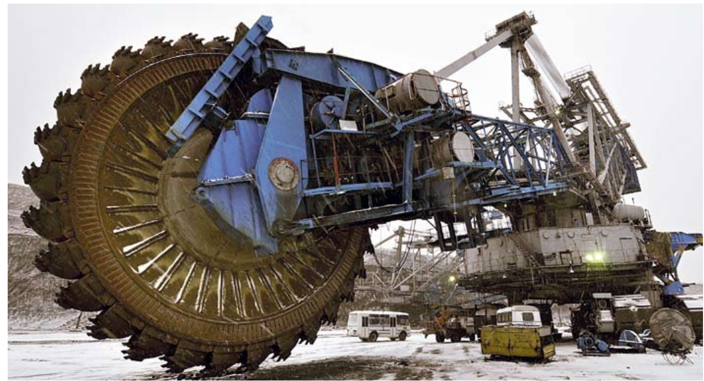
Jedno z největších rypadel světa těží v kazachstánském dolu Bogatyrskij neuvěřitelných 4,5 tisíce tun uhlí za hodinu.

Teprve praxe sice přinese skutečně správný výklad nového zákona, nicméně již z kontextu přijaté novely je zřejmé, že to Kazachstán myslí s atraktivitou pro zahraniční investice vážně a tímto byly vytvořeny skutečně příznivé podmínky. ■