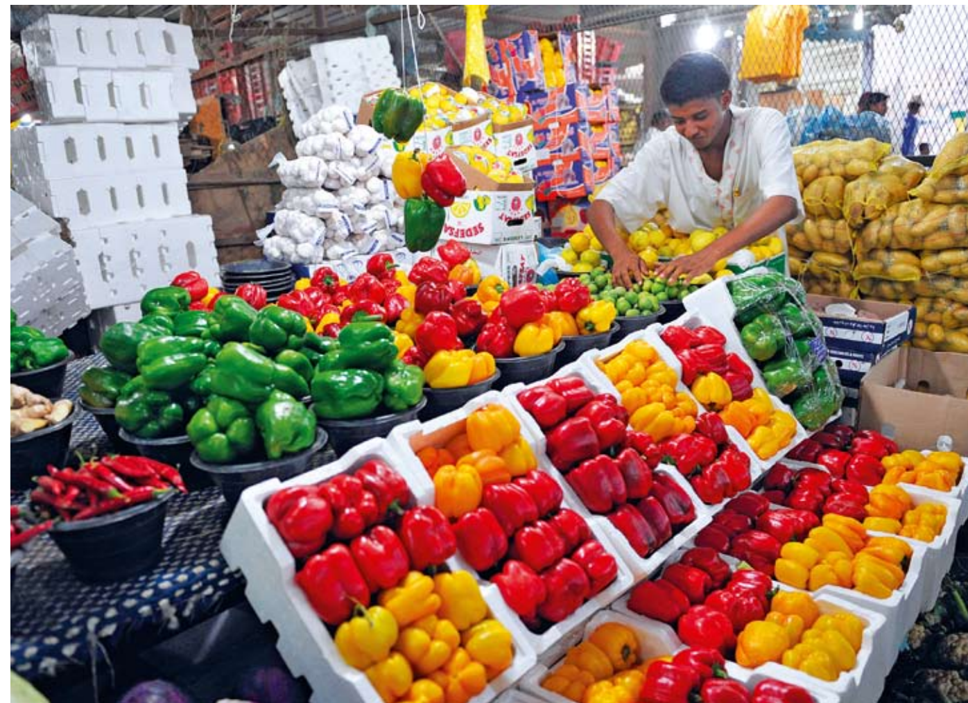
Saúdská Arábie nakupuje většinu jídla v zahraničí, proto jeden ze zemědělských diplomatů nastoupí i do této pouštní země.

Čeští podnikatelé se mohou těšit v první vlně na rozšířené kapacity zastupitelských úřadů v barském Rangúnu, keňském Nairobi, senegalském Dakaru a generálního konzulátu v americkém Los Angeles. Zbývající destinace budou v nejbližší době odsouhlaseny oběma resorty a také projednány se zástupci podnikatelského sektoru. ■