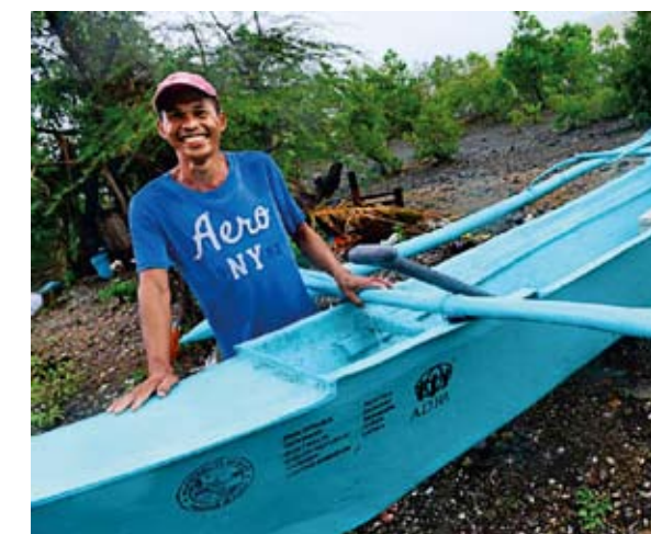
PRO RYBÁŘE. Společnost ADRA jim nahradila lodě, o které přišli při bouři.

Druhý loňský malý projekt podpořený českým velvyslanectvím v Manile spočíval v pomoci vybrané zemědělské společnosti v oblasti poškozené tajfunem Haiyan. Šlo o dodání fóliovníků a stavbu systému zavlažování a ochrany rostlin ve