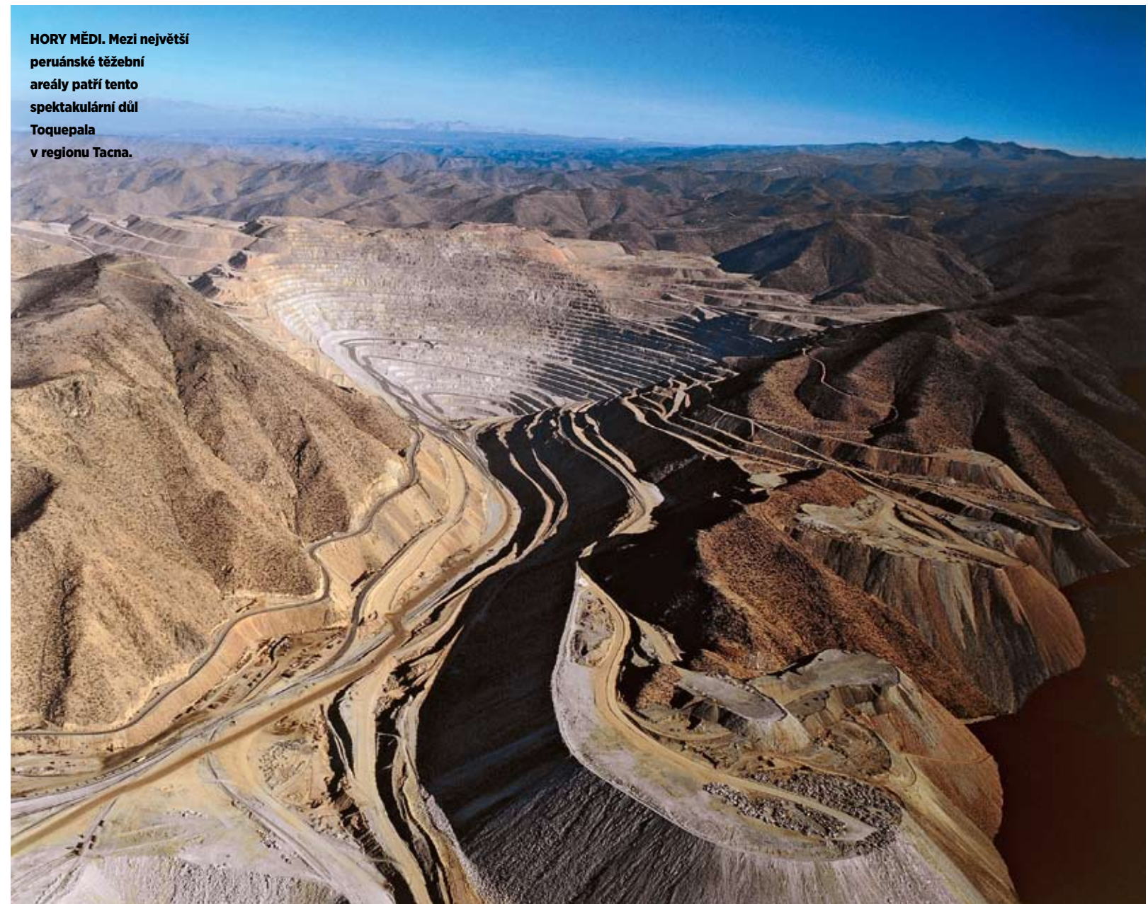
HORY MĚDI. Mezi největší peruánské těžební areály patří tento spektakulární důl Toquepala v regionu Tacna.

Platební schopnost velkých korporací v Peru je úzce sledována mezinárodními ratingovými agenturami. V průběhu nadcházejících měsíců není vyloučeno snížení ratingu, pokud se poptávka po kovech, jako je měď, zinek, olovo a stříbro, na světových trzích nevzpamatuje po loňském poklesu. Z největších těžebních společností s aktivitami v Peru (Southern Copper, Hochschild, Volcan, Minsur a Buenaventura) je vzhledem k současnému vývoji jeví jako finančně