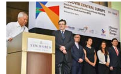
DO STŘEDNÍ EVROPY. Její turistický potenciál představili Filipíncům zástupci Česka a dalších zemí loni v Manile.

Jak se stomilionová země jihovýchodní Asie pomalu ekonomicky rozvíjí, na významu nabývá i turismus. Odhaduje se, že tři miliony