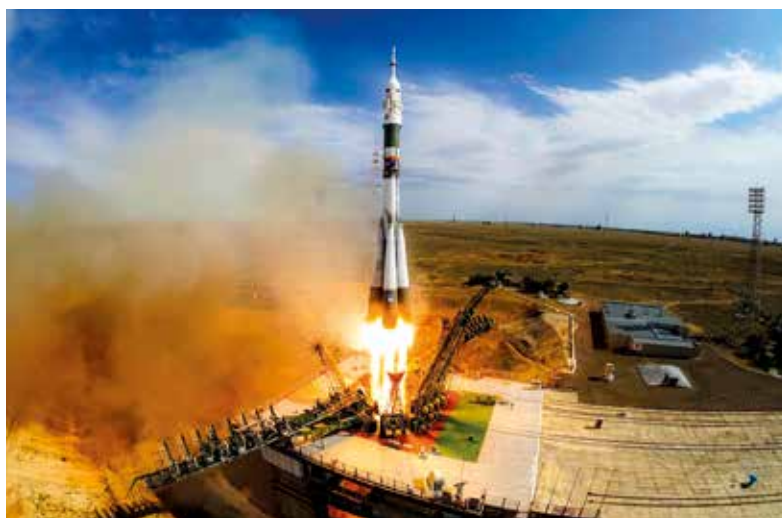
Rakety typu Sojuz startující z Bajkonuru zůstávají nejčastějším způsobem dopravy materiálu na oběžnou dráhu.

Rusové staví svůj vlastní kosmodrom Vostočnyj na Dálném východě z jasných důvodů. Tak citlivý a strategický projekt, jako je kosmická základna, chtějí mít na vlastním území a zcela pod svou kontrolou. Důvody jsou ale i ekonomické – Rusko ušetří sumy, které v současnosti platí za pronájem Bajkonuru. Projekt Vostočnyj začal v roce 2010, první raketa odtud vzlétla v roce 2016. Areál je s plochou něco přes tisíc kilometrů čtverečních šestkrát menší, než Bajkonur. Projekt zatím počítá s provozem tří ramp, stavbou čtyř stavek budov a také vybudováním běžného letiště. Ruský premiér Dmitrij Medveděv se ale loni ostro kritiku pustil do agentury Roskosmos s tím, že má stavba velké zpoždění a zatím je hotova sotva čtvrtina plánovaných prací.