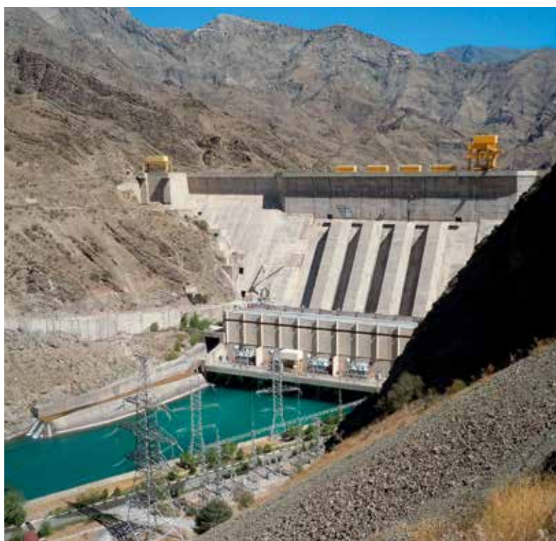
Dravé řeky v horách Kyrgyzstánu jsou pro zemi klíčovým zdrojem energie.

Vnitrozemský hornatý Kyrgyzstán je zemí s nízkými příjmy. Podle HDP na obyvatele jde o druhou nejchudší zemi v regionu. Ekonomika závisí na těžbě nerostů, zemědělství a peněžích, které posílají domů Kyrgyzové pracující zejména v Rusku. V roce 1998 se jako první z postsovětských zemí stal Kyrgyzstán členem WTO.