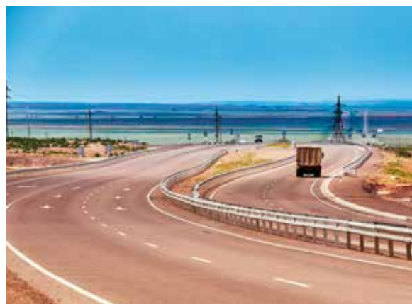
Dálnice protula Kazachstán od čínských hranic až k Rusku.

Co do počtu a pravidelnosti bych určitě zmínil dodávky technologií pro uhelné elektrárny, z hlediska objemu vývozu pak technologie pro strojírenské závody. Máme také radost z firem, které jsou úspěšné v oblasti potravinářství. Zmínil bych českého výrobce balicích strojů Velteko. Je příkladem toho, že v Kazachstánu je možné výrazně uspět, ale je to běh na dlouhou trať. Obecně se dá říct, že počet českých firem, které do Kazachstánu úspěšně vyvázejí, není velký. Pravdou ale je a ze zkušenosti víme, že pokud se zde firmě prorazí, následné objemy vývozu jsou pak velmi zajímavé. Velkou výhodou je taktéž přítomnost kanceláře CzechTrade v Almaty, která zde funguje od roku 2010 ve vzájemné synergii s Velvyslanectvím ČR v Nur-Sultanu. Společně dokážeme