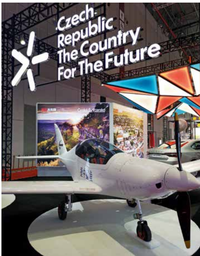
Největším oblíbencem objektivů se stal ultralight letoun Shark Aero, držitel několika světových rychlostních rekordů.