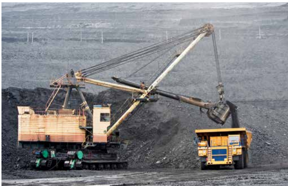
Kazachstán má obrovská ložiska uhlí, která sytí většinu místních elektráren.

Střední Asie je heterogenním regionem ať už z hospodářského či zahraničněpolitického hlediska. Navzdory mnoha společným rysům existují mezi těmito státy i značné rozdíly. Všechny jsou muslimské s dominantním sunnitským islám-