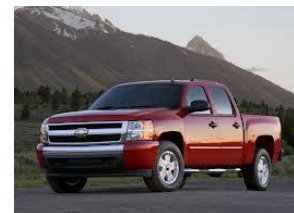
F série od Fordu a Chevrolet Silverado jsou nejpobulárnější auta pro skupinu 55+ let