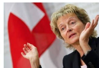
Švýcarská ministryně financí Eveline Widmar-Schlump uzavřela dohodu s Američany

Dohoda ale nezastaví kriminální stíhání 14 švýcarských bank , proti kterým již bylo zahájeno. O tom, jak mohou pokuty tvrdé, se již přesvědčila banka Wegelin & Company v roce 2012. Nejstarší švýcarská banka skončila, když se přiznala, že v období 2002-2010 pomohla americkým občanům ukrýt 1,2 miliardy a zaplatila pokutu $58 milionů. Banka přitom bez přestávky fungovala od roku 1741.