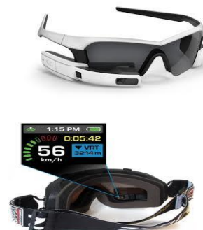
Běžci a lyžaři mohou získávat data za pohybu

o začátek fenoménu „Internet věcí“, který se má naplno rozjet s lepším propojením a větší inteligencí systémů, které budou vyhodnocovat data a podle potřeby přizpůsobovat fungování strojů a zařízení. Recon (www.reconinstruments.com) zatím nabízí dva druhy výrobků: Snow pro lyžaře, kteří si mohou přes zařízení, zabudované v lyžařské helmě, vyhodnocovat data o všem, co je spojeno s jejich sjezdem a Jet, který je zabudován do slunečních brýlí a míří především na cyklisty a běžce. (eweek.com)