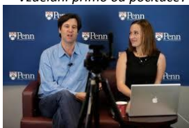
Příprava většiny kurzů nevyžaduje příliš velké investice