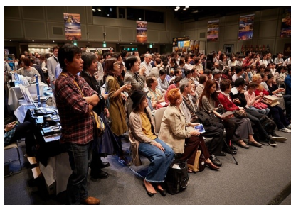
Český festival 2018