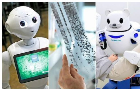
Ilustrační foto @ The Telegraph

Má-li Japonsko s Českou republikou něco společného, je to velmi nízká nezaměstnanost, zejména právě i díky rychle stárnoucí populaci. Společnost se proto otevírá cizincům. Vláda počítá s příchodem až stovek tisíc zájemců zejména do zemědělství, stavebnictví, zdravotní péče či pohostinství. V dubnu roku 2019 vznikne nová vládní agentura, která bude mít management přicházejících na starosti, současně se více zaměří i na nelegální zaměstnávání cizinců či soužití Japonců s přistěhovalci.