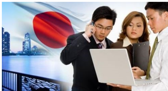
Ilustrační foto @ The Tokyo Times

I přes výše uvedené nedostatky zůstává Japonsko dlouhodobě jednou z ekonomicky nejúspěšnějších zemí světa, spolehlivým a lukrativním obchodním partnerem a přes nesporná specifika japonské obchodní kultury velmi atraktivním cílovým trhem. Pro české, potažmo evropské firmy se pak na jaře 2019 stane také partnerem zatíženým daleko menším počtem tarifních i netarifních překážek obchodu, neboť v té době vstoupí v platnost Dohoda o ekonomickém partnerství mezi EU a Japonskem.