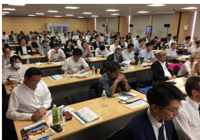
Účastníci podnikatelského a investičního fóra

S Rokem českého byznysu naše snahy a proaktivní podpora českých produktů na japonském trhu nekončí. Na jaře 2019 vznikne díky Dohodě o ekonomickém partnerství mezi Evropskou unií a Japonskem (EPA) největší zóna volného obchodu na světě. Toho je třeba využít. Naším firmám se otevírají jedinečné příležitosti a exportní potenciál japonského trhu. A Velvyslanectví České republiky v Tokiu bude společně s vámi u toho.