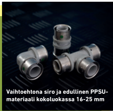
Vaihtoehtona siro ja edullinen PPSU-materiaali kokoluokassa 16-25 mm