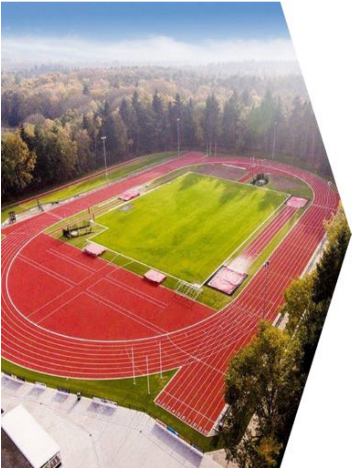
Foto: Atletiekbaan AV'34