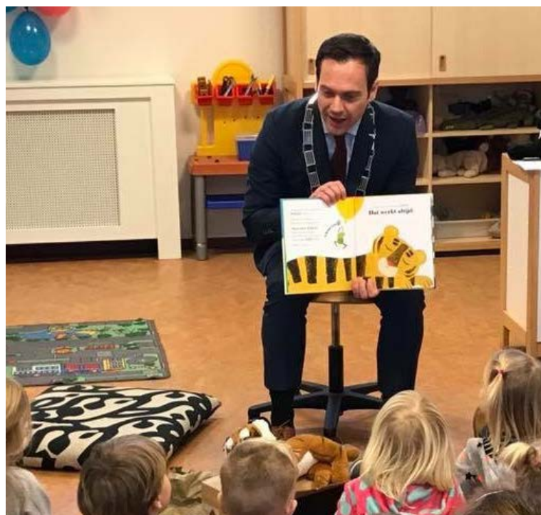
Burgemeester Potters leest voor op een peuterspeelzaal tijdens de Nationale Voorleesdagen.