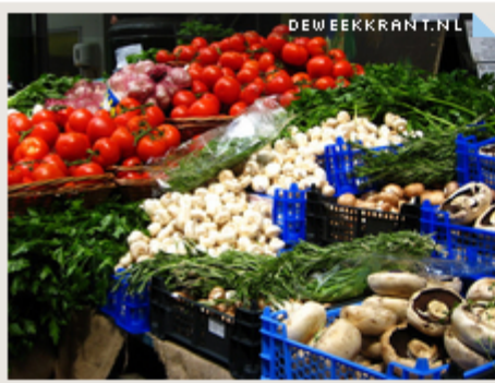
Minder regels voor de markt

AF DEVENTER - Met een nieuwe marktverordening en inrichtingsplannen voor de markten op de Brink en Beestenmarkt, in Keizerslanden, Flora en Schoolstraat en voor de Goede Vrijdagmarkt en Kerstmarkt kiest het college van Deventer voor verdere kwaliteitsverbetering en minder regels.