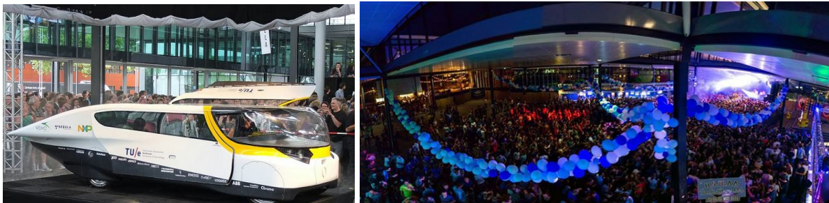
Afbeelding 1 & 2: De twee primaire functies van de markthal; Presentaties/exposities en grootschalige studentenevenementen.

Sinds de opening van de Markthal in 2012 zijn er al vele evenementen georganiseerd in de centraal gelegen hal. Met het benoemen van kleinschalige borrels, grote feesten, de presentatie van de zonneauto's Stella en Stella Lux, exposities tijdens de Dutch Technology Week en de TU/experience day doen we slechts een kleine greep uit de vele evenementen die de Markthal reeds heeft gehuisvest. Daar de Markthal met zijn primaire functie als evenementenlocatie onderdeel uitmaakt van een van de belangrijkste gebouwen van de TU/e, het Metaforum (dat onder andere de bibliotheek huisvest en dienstdoet als dagelijkse ontmoetingsplek van studenten 3 ), kan de Markthal met recht “het bruisend hart van de studentencampus” genoemd worden.