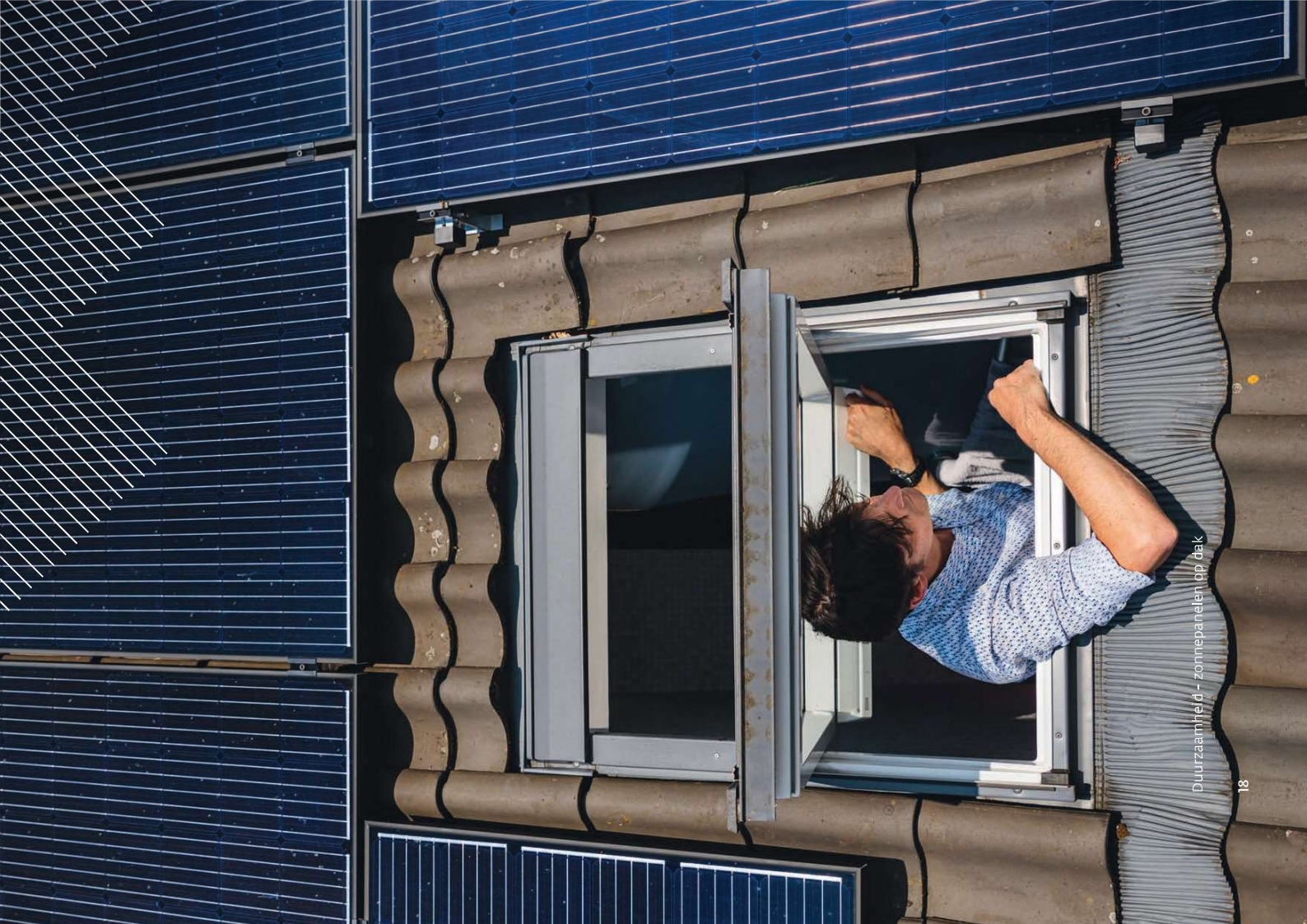
Duurzaamheid - zonnepanelen op dak

We moeten leren leven met een veranderend klimaat en de gevolgen daarvan. Op het gebied van klimaatadaptatie en waterveiligheid is dan ook veel te doen. Dit alles vraagt voor de komende jaren veel inzet van de gemeente. En ook inspanning van organisaties, bedrijven en inwoners. Het vraagt dat we als samenleving en overheid niet in beperkingen denken, maar in mogelijkheden. En samen aan de slag gaan. Zodat er begin 2026 zichtbare stappen zijn gezet in het besparen van energie, het verminderen van onze CO2 uitstoot, het terugdringen van water- en hitteoverlast bij extreem weer en het versterken van biodiversiteit.