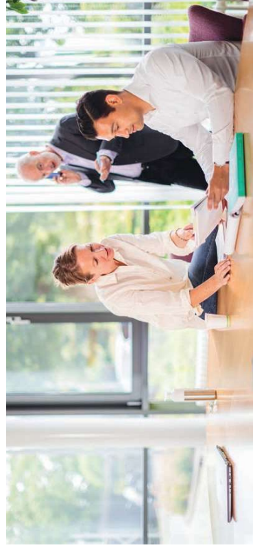
Economie, arbeidsmarkt en onderwijs