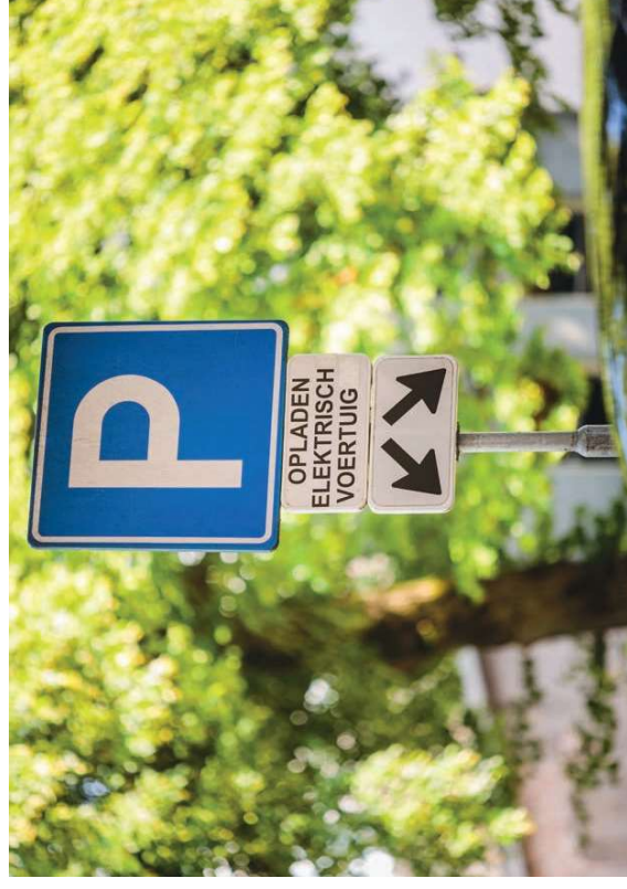
Duurzaamheid - Laadsystemen voor elektrisch rijden