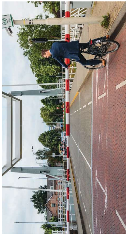
Mobiliteit - Korte brug