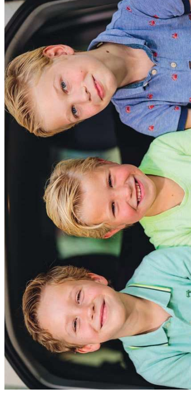
Samenleving - De jeugd heeft de toekomst