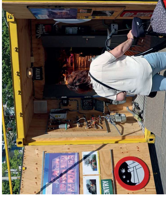
Veiligheid – handhaving en preventie