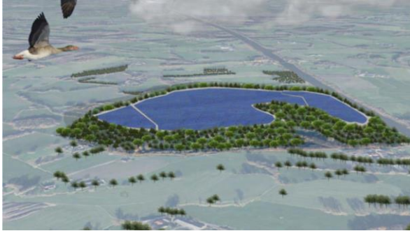
Impressie zonnepark 't Rikkerink (16 ha)