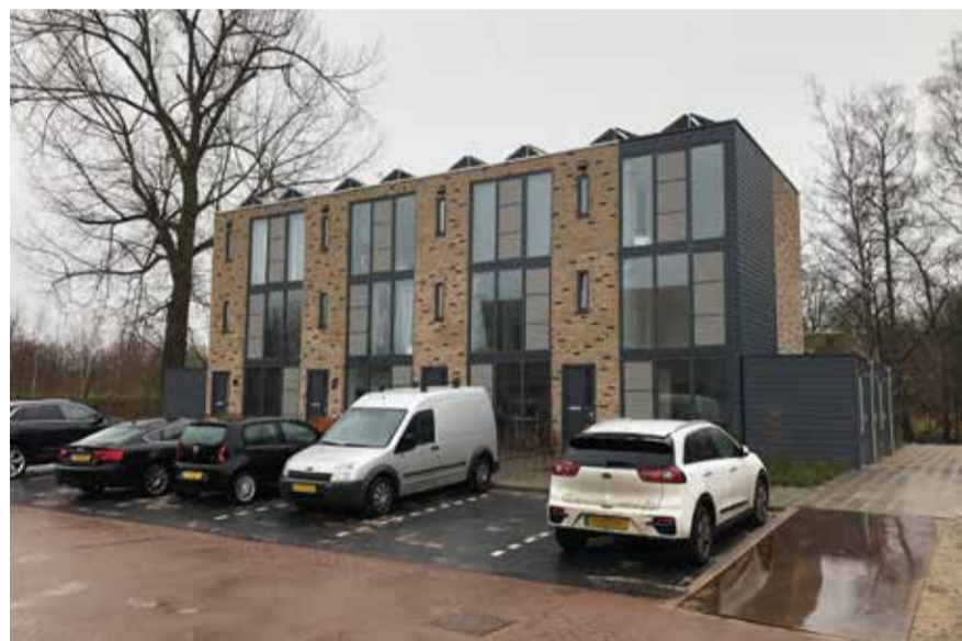
Een voorbeeld van de woningen die de basis vormen van het VVD Woonplan.

Maar het is nog lang niet genoeg. Inmiddels is ook duidelijk dat jongeren en alleenstaanden in de oververhitte markt nauwelijks aan bod komen. De VVD Hollands Kroon vindt dat niet terecht. Werkende jongeren met een bescheiden inkomen verdienen een betaalbare woonkans. Met het VVD Woonplan komt die binnen handbereik. Als de markt het niet oppakt behoort een gemeentelijk initiatief tot de mogelijkheden.