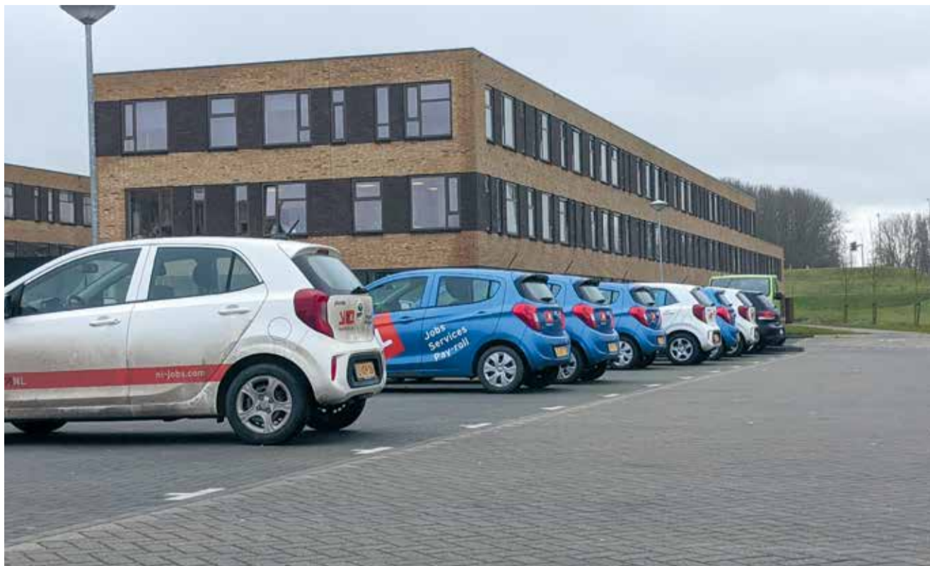
Arbeidsmigranten zijn belangrijk en verdienen goede huisvesting.

Er zijn weinig thema's die de afgelopen jaren zoveel publieke aandacht hebben gekregen als de huisvesting van arbeidsmigranten. De VVD Hollands Kroon is er helder over: Als we het niet oplossen, komen we arbeidsmigranten tegen op plekken waar we dat niet willen. Daarom zijn we vóór de ontwikkeling van logies-accommodaties. Maar wel met inachtneming van omwonenden en andere belanghebbenden.