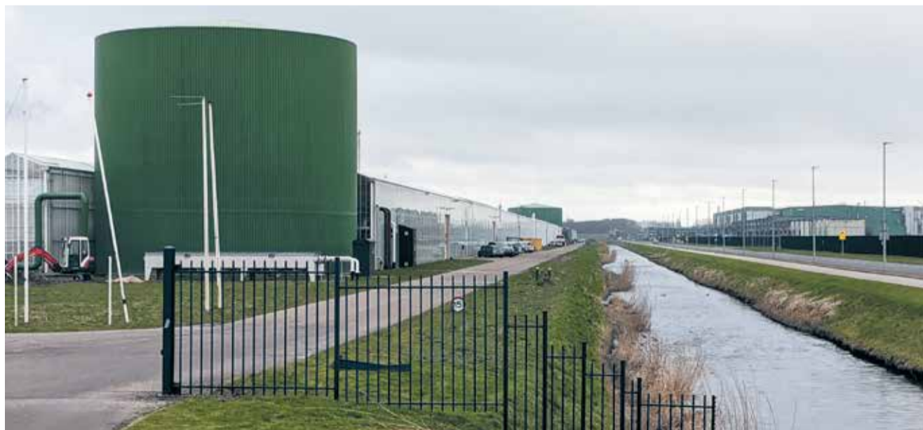
Kassen en datacenters zorgen voor veel werkgelegenheid.

Is het realistisch dat een plattelandsgemeente een economische agenda heeft? De VVD Hollands Kroon vindt van wel. Economie is direct of indirect het antwoord op heel veel vraagstukken. Een florierende economie zorgt voor een over het algemeen florierende samenleving. Maar bij al die groei en ontwikkeling is het wel belangrijk dat de balans tussen groei en leefbaarheid wordt bewaakt.