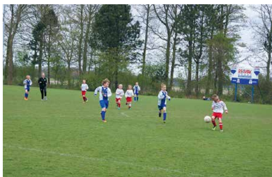
De basis van lekker sporten ligt in de kindertijd.

De VVD Hollands Kroon vindt dat verenigingen en hun accommodaties toekomstbestendig moeten zijn. We steunen het beleid dat niet de club wordt gesubsidieerd, maar de activiteit. Uiteraard alleen als die voldoet aan de door de gemeenteraad gestelde voorwaarden. Daarnaast wil de VVD Hollands Kroon erop sturen dat sportaccommodaties ook worden ingezet voor naschoolse opvang. Bij Sportcampus de Terp in Wieringerwerf is begonnen met de realisatie van het complex en in Winkel/Niedorp en Anna Paulowna/Kleine Sluis wordt nagedacht over een