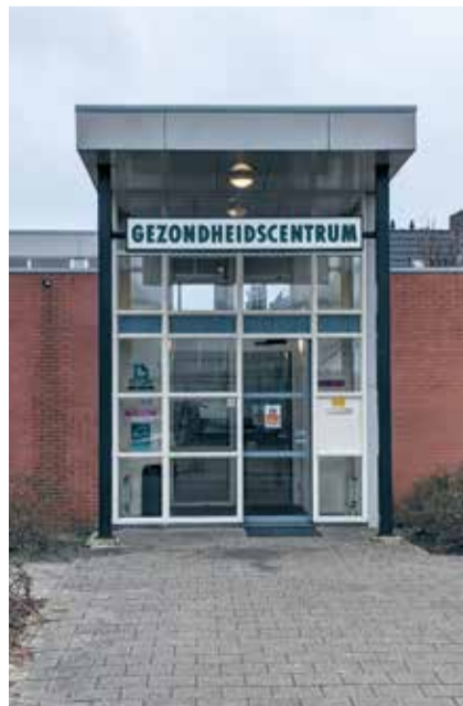
Goede en toegankelijke zorg is belangrijk.

Dat geldt ook voor de kosten van generiek toegekende huishoudelijke hulp. Hiervoor zijn we huiverig. Het is voor ons bespreekbaar om de