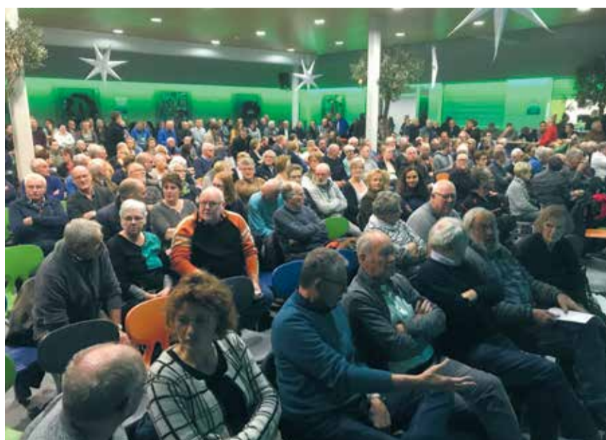
Een informatieavond over woningbouw in Wieringerwerf trok honderden belangstellenden.

Het VVD Woonplan is ook geschikt voor wooncorporaties in onze gemeente. Omdat de woningen verplaatsbaar zijn, kan op termijn worden ingespeeld op veranderende vraag. Daarnaast voldoen ze aan hoge eisen van duurzaamheid. De bouw vindt plaats in een fabriek en is dankzij het gebruik van gecertificeerd hout bijna volledig circulair. Van CO2-