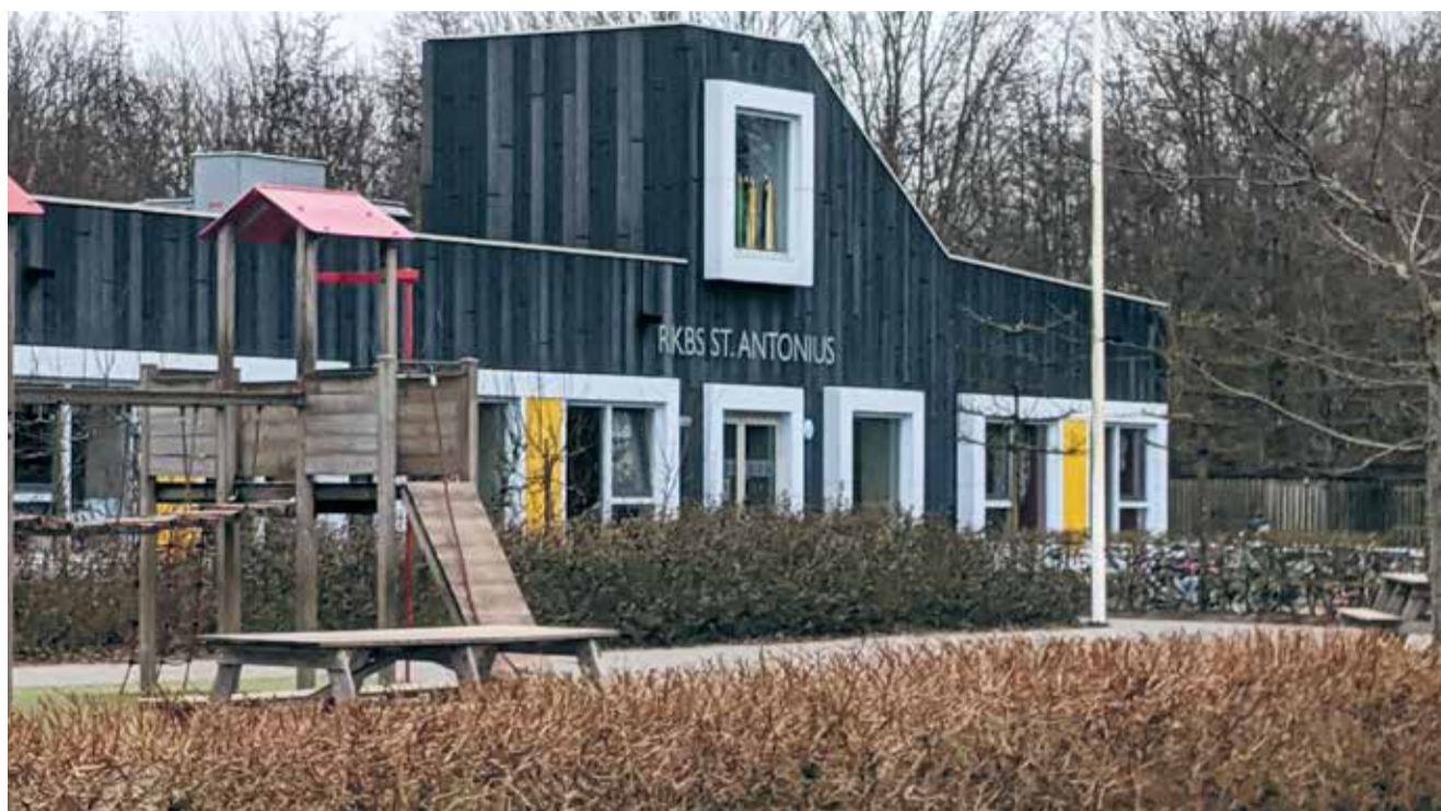
Het onderwijs verdient moderne en goede huisvesting.

Op school leren we kinderen de kennis en vaardigheden waar ze later iets aan hebben. Op school leren we ze ook wat onze normen en waarden zijn en hoe we in Nederland met elkaar omgaan. Op school leer je wat normaal is en wat niet. Goed onderwijs speelt daarom niet alleen een grote rol in het leven van mensen, maar ook de samenleving heeft er belang bij. Wij zijn trots op onze leraren voor de klas.