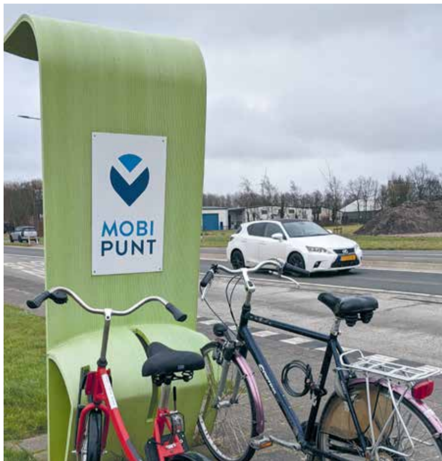
Het Mobipunten-netwerk wordt verder uitgebreid in de regio.

Wij ondersteunen initiatieven voor een geïntegreerd vervoersysteem voor het vervoeren van scholieren,