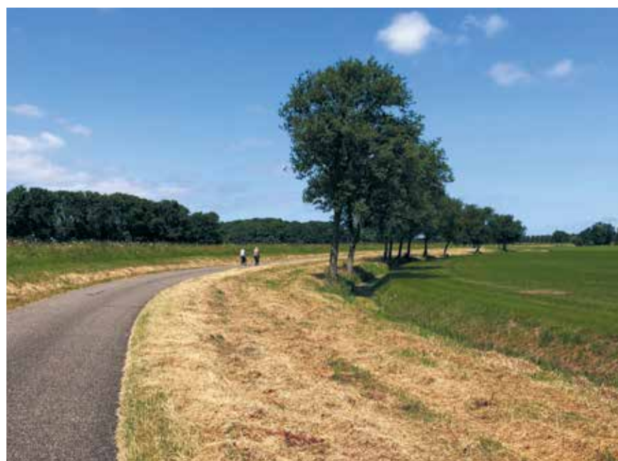
Zo ziet de VVD Hollands Kroon het graag: een mooi uitzicht met netjes gemaaide bermen.

Niet alleen vanwege het woongenot, ook vanuit veiligheidsoogpunt is dit noodzakelijk. Zo vindt het maaien van bermen nu plaats op specifieke datums. De natuur laat zich echter niet leiden door de kalender. Daarom vindt de VVD Hollands Kroon dat we