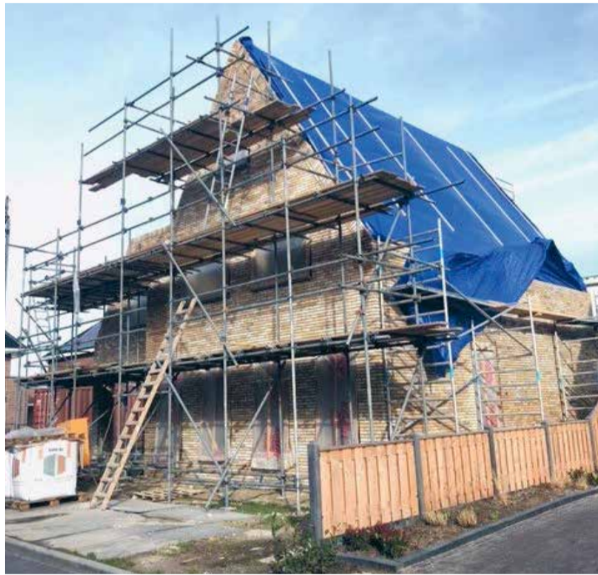
De wethouder Wonen moet zorgen voor 3.000 nieuwe woningen in 2030.

Er wordt op de diverse plekken in de gemeente volop huur- en koopwoningen gebouwd. Zo zijn er grote projecten in voorbereiding en uitvoering in Wieringerwerf, 't Veld, Anna Paulowna, Wieringen, Winkel en Niedorp. Ook zijn er nog diverse kleinere plannen in de kernen waar woningbouw gepleegd wordt. In december 2020 heeft de raad van Hollands Kroon de woonvisie vastgesteld. Hierin stellen we dat we ons richten op groei, sturen op doelgroepen en inzetten op nieuwe initiatieven. Een visie krijgt echter pas betekenis als we hier actief aan werken. Daarom vindt de VVD dat er een wethouder expliciet moet worden benoemd als wethouder Wonen. Deze wethouder gaat proactief op zoek naar locaties en mogelijkheden zodat de woningbouw in een versnelling kan komen. De VVD wil voor 2030 in Hollands Kroon 3.000 nieuwe