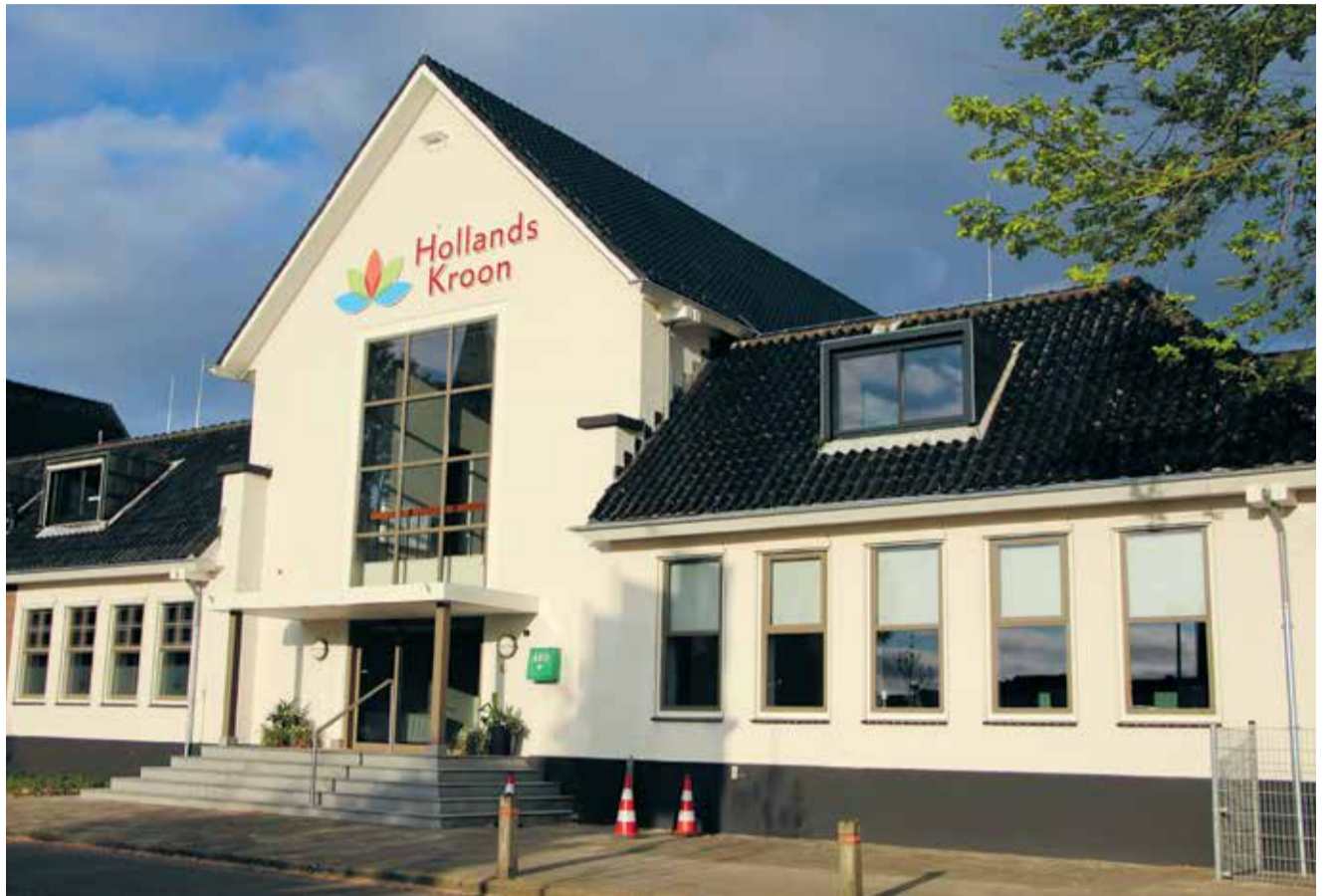
De gemeente staat ten dienste van de inwoners en bedrijven.

Het vertrouwen van inwoners in de gemeente staat steeds meer onder druk. De gemeente moet ten dienste staan van haar inwoners, en niet andersom. We kunnen natuurlijk niet zonder regelgeving waarin staat wat wél en niet kan. Maar onnodige of onuitvoerbare regelgeving dient geschrapt te worden.