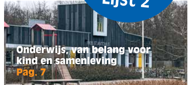
Onderwijs, van belang voor kind en samenleving Pag. 7