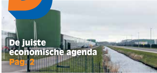
De juiste economische agenda Pag. 2