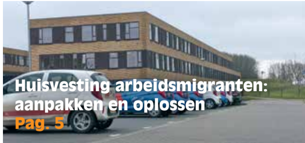
Huisvesting arbeidsmigranten: aanpakken en oplossen Pag. 5