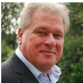
Michiel Krom Communicatie en Campagne