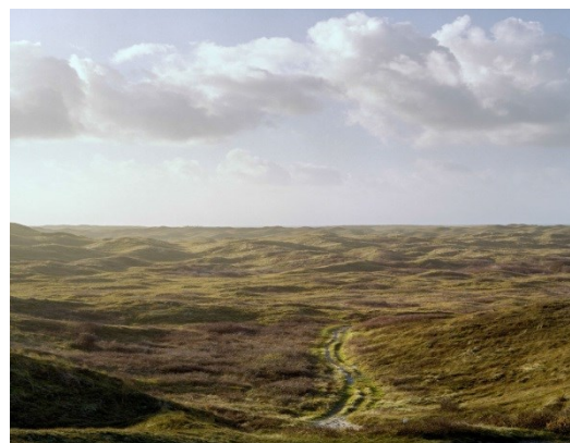
Stiltegebied Eierlandse Duinen

En geen geluidsreducerende maatregelen nemen daar waar de kosten niet opwegen tegen de effecten. Aanbevelingen van de Rekenkamer zoals de toegankelijkheid van stiltegebieden verbeteren en stiltegebieden inzetten om het bereiken van andere beleidsdoelen te ondersteunen, juicht de VVD van harte toe.