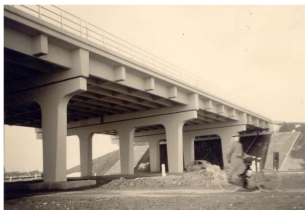
Viaduct A9 over de N203 bij Uitgeest, 1958

Echter was de Nulplus-variant niet volledig uitgewerkt. Om een Milieu Effect Rapportage (MER) te kunnen opstellen en ook iets zinnigs te kunnen zeggen over de aanlegkosten, moest de Nulplus-variant uitgewerkt worden tot eenzelfde niveau als de andere varianten.