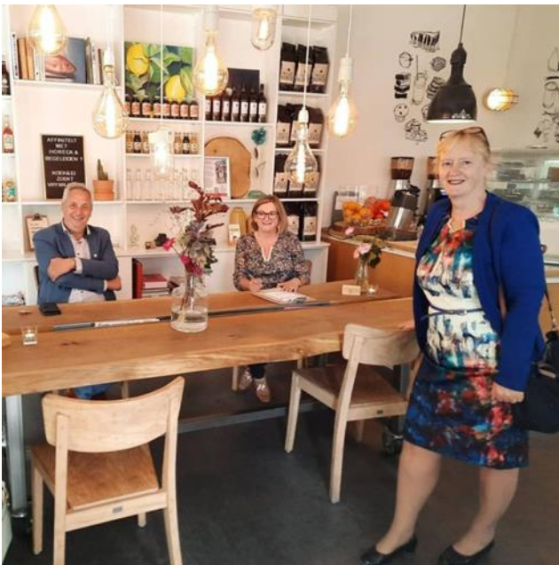
Koek en Ei Driebergen