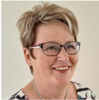
Van de voorzitter

Ons gedrag is de enige verantwoordelijkheid waarmee we het virus in bedwang kunnen houden”.