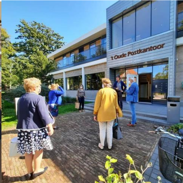
Ontmoetingscentrum De Vijver Driebergen