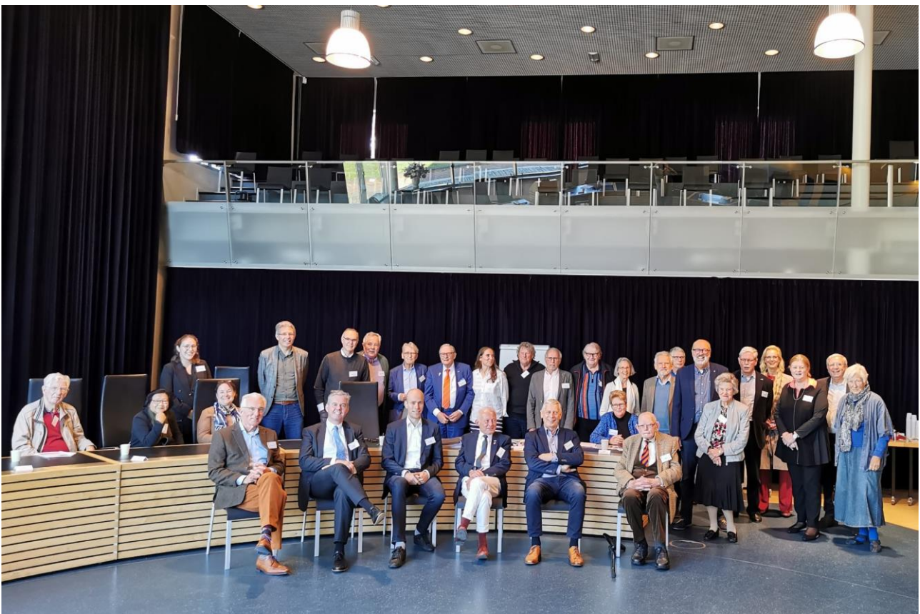
Bijeenkomst in Gemeentehuis Utrechtse Heuvelrug op 8 oktober 2021.