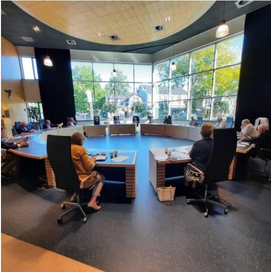
Foto: Doorn, raadszaal overleg coördinatoren

Eindelijk een fysieke bijeenkomst! Met de provinciale coördinatoren in raadszaal van het gemeentehuis van de Utrechtse Heuvelrug.