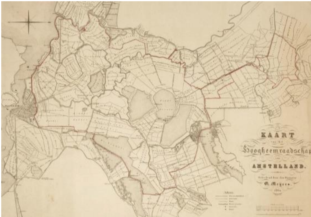
Kaart van het Hoogheemraadschap Amstelland in 1860