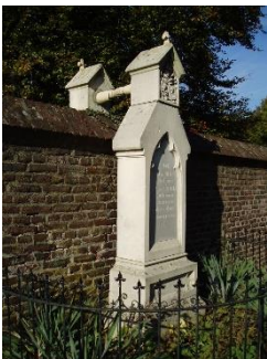
Foto J. Verheesen / CC BY-SA ( https://creativecommons.org/licenses/by-sa/3.0 )

https://nl.wikipedia.org/wiki/Graf_met_de_handjes/