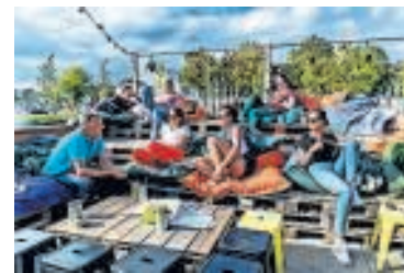
▲ Roost aan de Singel op een zomerse dag.