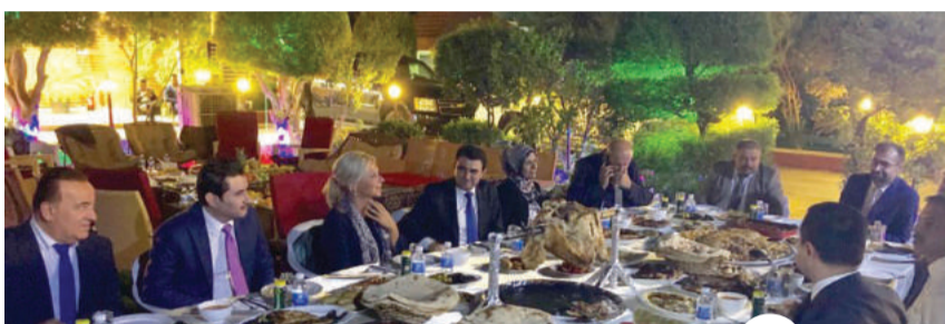
Aan tafel met Iraakse Parleментарiërs