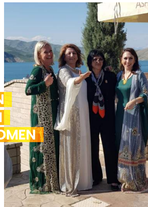
In Koerdische traditionele outfit