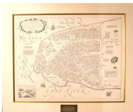
Tekening Nieuw Amsterdam, een geschenk van Donald Trump