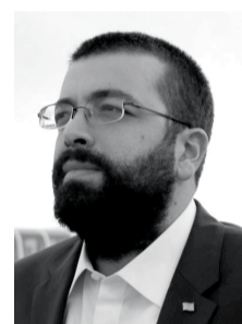
Ahmad El Hariri PARTIJVOORZITTER FUTURE MOVEMENT

Begin november 2017 kondigde Hariri plotseling zijn ontslag aan vanuit Saoedi-Arabië, tot grote verwarring en consternatie van de rest van de landen in het Midden-Oosten. Libanese politici beschuldigde Saoedi-Arabië ervan Hariri tegen zijn wil vast te houden. Hariri zelf liet juist weten dat hij met zijn vertrek sancties van de Golfstaten tegen Libanon - vanwege de inmenging van Hezbollah en Iran in de regio - probeerde te voorkomen. Ook zou Hariri vrezen voor pogingen tot een aanslag. De hele affaire zorgde voor spanningen tussen Saoedi-Arabië, Libanon, Hezbollah en Egypte, maar dit liep met een sissers af. Na de weigering van de Libanese president om het ontslag van Hariri te accepteren en na bemiddeling van de Franse President Macron keerde Hariri op 22 november weer terug naar Libanon en trok hij zijn ontslag weer in.