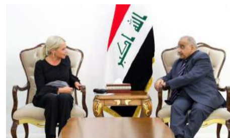
In gesprek met Adil Abdul-Mahdi, de premier van Irak