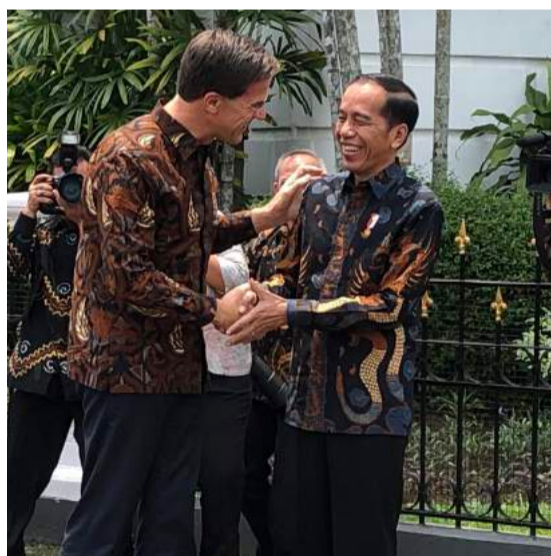
Ontmoeting met de president van Indonesië