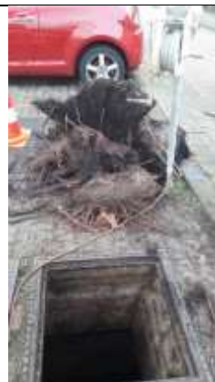
25/01, boomwortels uit riool , Amazoneweg, Delft, Geert