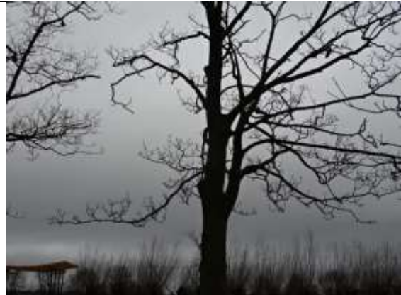
28/01, silhouet boom , Abtswoudse park. Freek Boon.