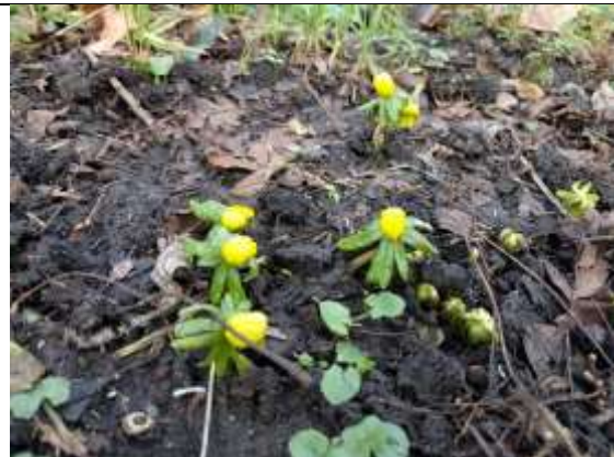
28/01, winterakoniet , Wielengahof Delft. Willemein Poot.