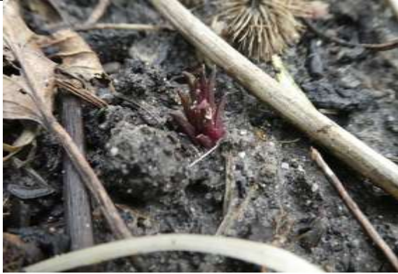
22/01, Canadese gulderoede , tuin Den Hoorn. Willemein Poot.