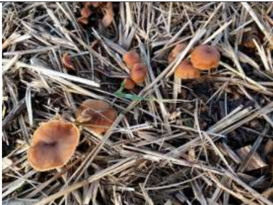
28/01, botercollybia , Laan der Verenigde Naties, Delft. Willemein Poot