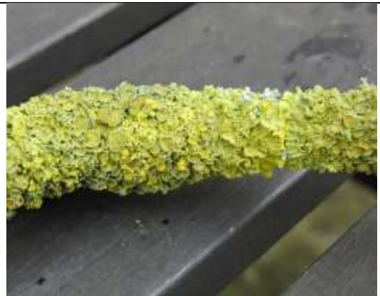
21/01 groot dooiermos Syriësingel Delft. Aukje Gjaltema.