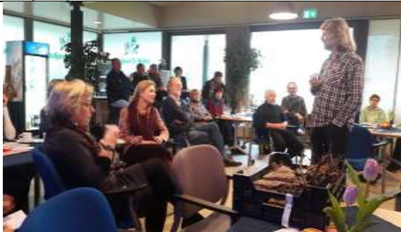
27/01, groencafé paviljoen Te Werve Huys de Wervelaan 110 Rijswijk.