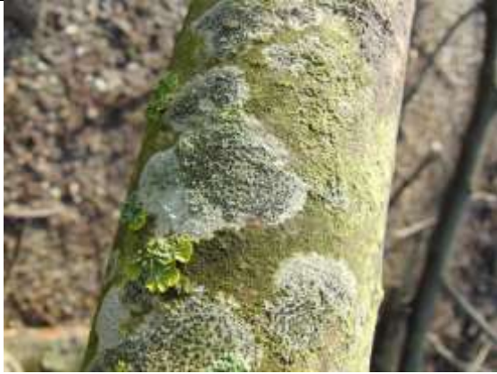
26/01, omgevalen boom Abtswoudse bos, Aukje Gjaltema.