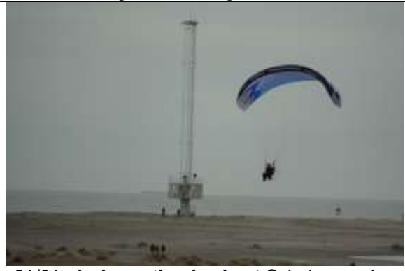
. 21/01, druk westlandse kust Schelpenpad. Aad van Uffelen.