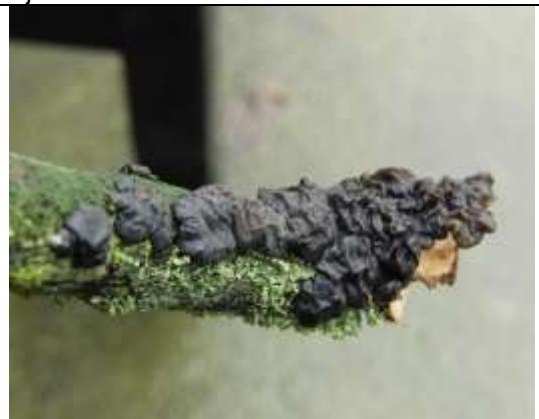
21/01, zwarte trilzwam , Syriësingel Delft. Aukje