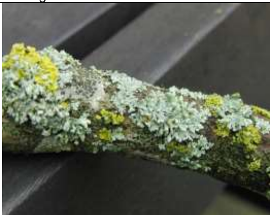
21/01, kapjesvingermos, melige schotelkorst