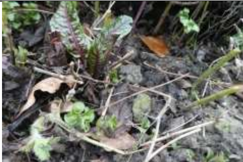
22/01, watermunt en de bloedzuring , tuin Den Hoorn. Willemein Poot.