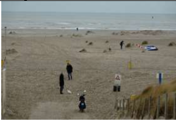
. 21/01, druk westlandse kust Schelpenpad. Aad van Uffelen.