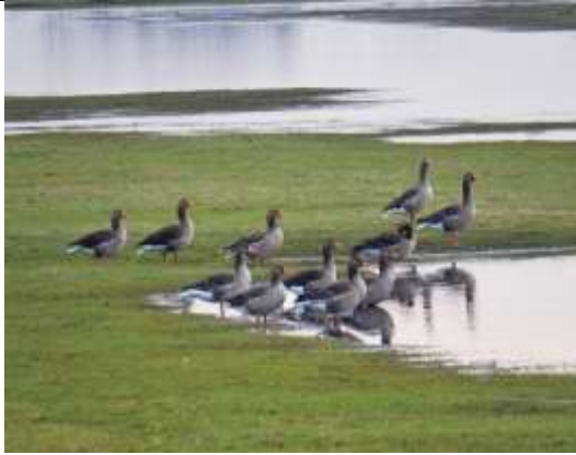
20/01, grauwe ganzen , Zuidpolder bij Delfgauw. Pia Legerstee.