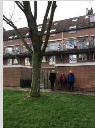
Es, Wil Borst

Een zestal bewoners hebben geprotesteerd tegen een aangevraagde kapvergunning voor een volwassen es in het groengebiedje aan de achterzijde van de Latijns Amerikalaan 24. De omwonenden hebben gevraagd of de KNNV hen wilde ondersteunen. De KNNV heeft inmiddels zelf bezwaar aangetekend met verwijzing naar de bezwaren van de bewoners. Daarnaast wijst de KNNV op twee extra punten. De es heeft het momenteel als soort in Europa erg moeilijk. Meer dan 95% gaat dood door de essentakziekte. Wonder boven wonder lijkt de boom in het groengebiedje achter de Latijns Amerikalaan nog in gezonde staat. Een heel belangrijke reden om de boom te laten staan en te kijken of het resistente zaad van de boom moet worden gewonnen voor uitzaai elders. Tweede punt is dat de KNNV en omwonenden nu net in overleg zijn met de aannemer van het complex bejaardenappartementen Chilipad 1, dat in hetzelfde groengebied ligt. Hier gaat het nu net ook om het behoud van twee volwassen en nog in kennelijk gezonde staat verkerende essen naast een aantal knotwilgen.