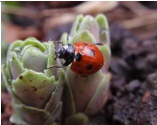
22/01, lieveheersbeestje achtertuin, Delfgauw. Pia Legerstee.