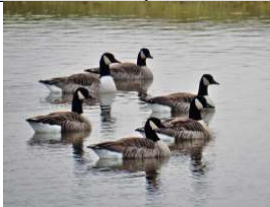
20/01, Canada ganzen , Zuidpolder, Delfgauw. Pia Legerstee.