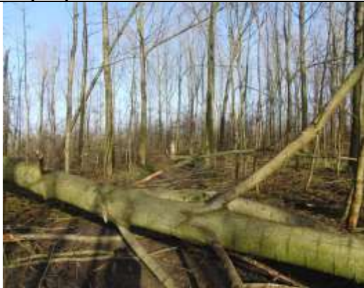
26/01, omgevalen boom , Abtswoudse bos, Aukje Gjaltema.