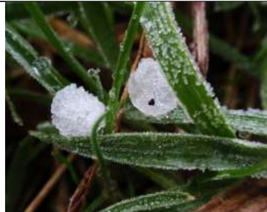
20/01, vastgevroren hagel , Delfgauw, achtertuin. Pia Legerstee.