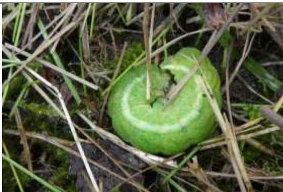
2/01 goudvenstertje? tuin Den Hoorn, Willemein Poot.