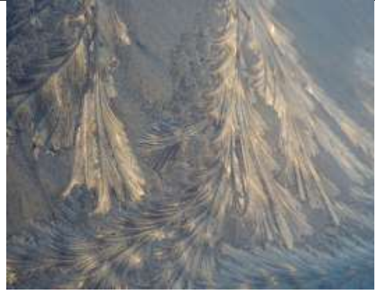
21/01, zonlicht gevangen in ijsbloemen op de autoruit , Delfgauw. Pia Legerstee.