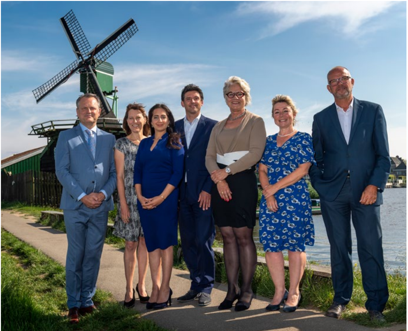
Foto gemaakt op 11 juni op de Zaanse Schans