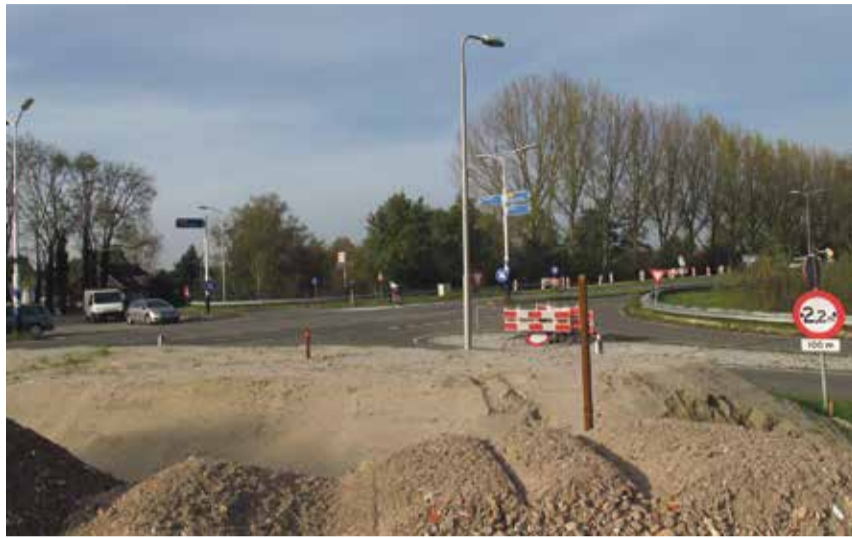
Onderdeel van het groot onderhoud van de N206 is de aanleg van een rotonde bij Stompwijk.

Sommige goede provinciale wegen, zoals die langs de Oude Rijn, zijn vanwege de nabijheid van snelwegen plaatselijk afgewaardeerd tot 60 km-weg. Andere kregen te maken met verkeersremmende maatregelen door het plaatsen van een keur aan obstakels. De gemiddelde doorstroming op de provinciale wegen is gemiddeld krap 50 km per uur. Zo wordt het interregionale verkeer als het ware gedwongen om de snelweg te kiezen. Het resultaat: meer gereden kilometers, geen tijdswinst en filevorming in de spits.