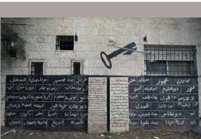
Ein Graffiti im Deheishe-Camp erinnert an die palästinensischen Dörfer, die bis 1948 die Heimat der Flüchtlinge waren.

Er ist mit seiner Facharztausbildung schon fast am Ende, hat in allen Abteilungen des Caritas Baby Hospitals gearbeitet und so ein differenziertes Wissen in Kinderheilkunde erlangt. „Für mich ist die Arbeit