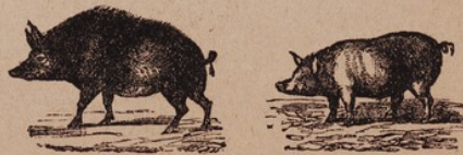
Свиновники безъ порфедя.