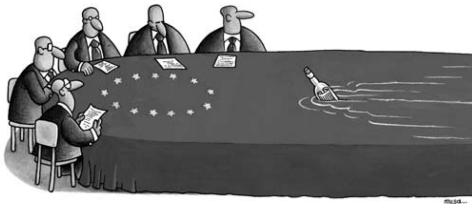
I PREMIO: MUSA GOMUS (TURQUÍA), "UNIÓN EUROPEA".

bolizado nas mulleres que tecen as bandeiras, utilizando as mesmas bólas de fío. Lamentablemente, e de novo como ao longo destas últimas décadas, ese desexo que representa o debuxo quedou superado por un novo estalido da violencia e a desproporcionada e brutal reacción do goberno de Israel, ao bombardear a Gaza. Aínda que o debuxo queda superado pola realidade, non deixa de ter vixencia como un desexo nun futuro esperemos próximo. Corresponde á ONU e aos gobernos de Europa e Estados Unidos impolo se é que realmente existe vontade de alcanzar esa paz. Polo momento a realidade queda marcada polos centos de mortos palestinos".