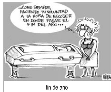
fin de ano