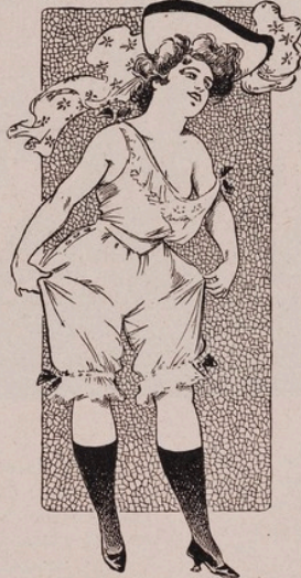
Ларчикъ. «Магдалина» изъ обители съ «Карповки».

—Ахъ, да пускай свѣтъ осуждаетъ, Ахъ, да пускай кланетъ молва, Что Витте много общается Едва-ли новость, господа!