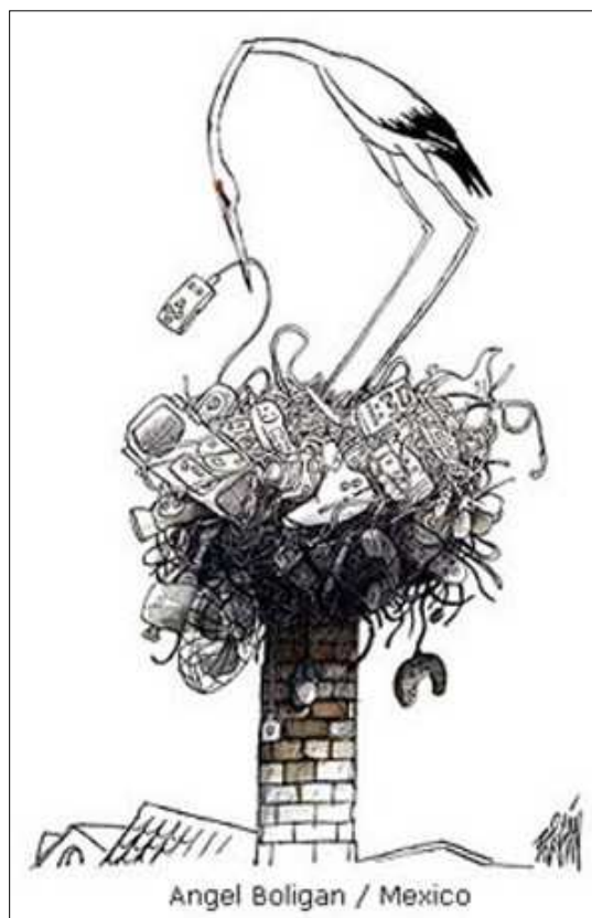
Angel Boligan / Mexico