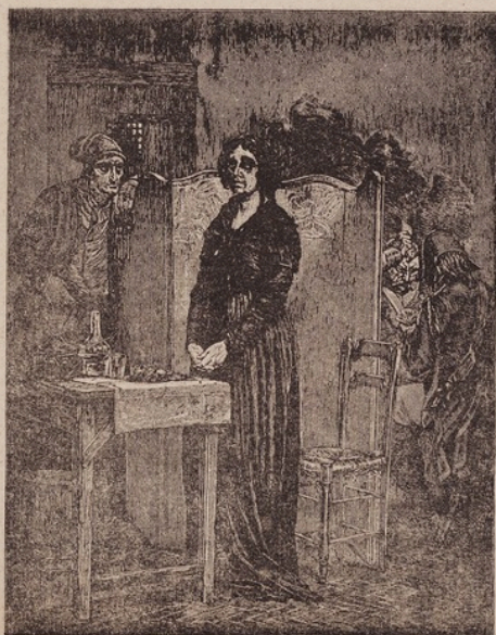
Марiя-Антуанета въ темницѣ.

Гдѣ были гренатеры московскаго гарнизона, пѣхотные полки:—Екатеринославскiй, Ростовскiй, Перновскiй, Несвижскiй, Киевскiй, Таврическiй, Самогитскiй и Астраханскiй во время пребыванiя въ Москвѣ Семёновскаго полка?