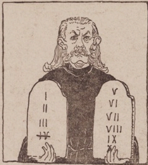
Десять современныхъ правилъ для россійскихъ обывателей

Второй номеръ журнала „Гудокъ“ въ полномъ объемѣ (8 стр., 14 рис.) выйдетъ въ свѣтъ 11-го января. Адресъ редактора—Пушкинская, 20. Цѣна отдѣльнаго номера въ кіоскахъ и у газетчиковъ—15 к. Подписка впредь до особаго извѣщенія не принимается.